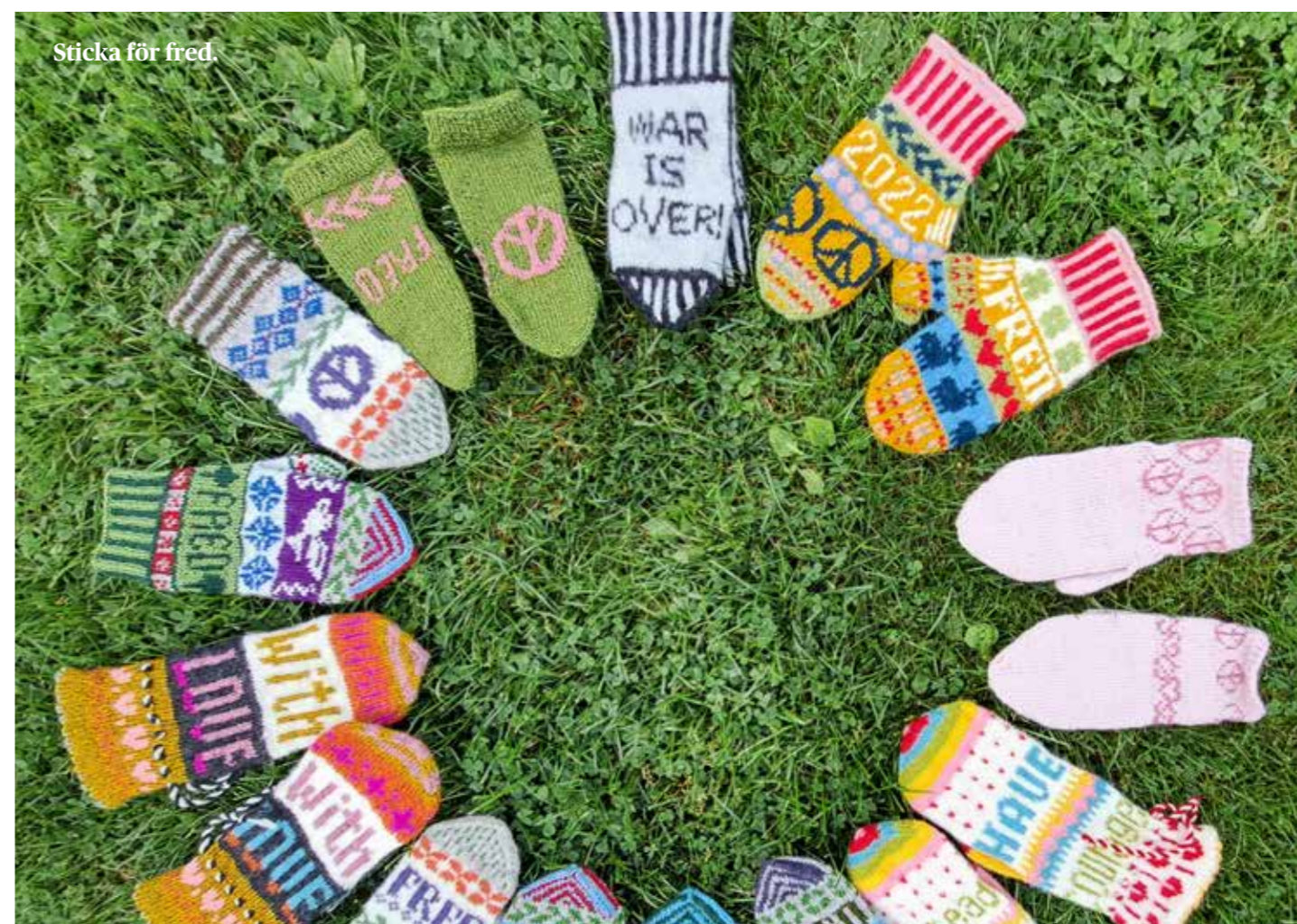
Sticka för fred.