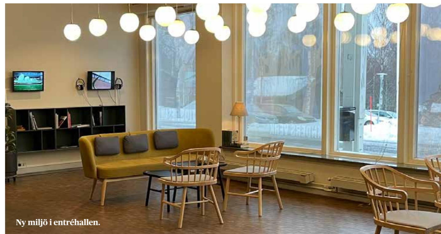
Ny miljö i entréhallen.

Under fyraårsperioden har flera insatser också gjorts för att förbättra de publika ytorna i museibygnaden, vilket är något som inte funnits med i målen nedan. En viktig insats har varit att utveckla entrén i museibygnaden till en mötesplats. En ny miljö i form av nya möbler och sittplatser samt ny belysning har skapats och entrén har därmed blivit avsevärt mer funktionell och välkomnande.