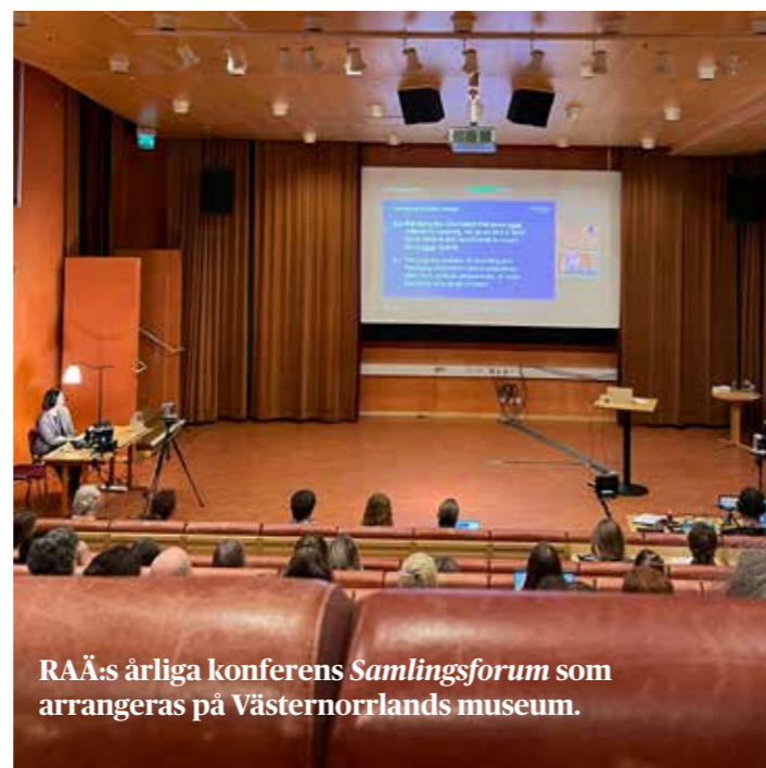
RAÄ:s årliga konferens Samlingsforum som arrangeras på Västernorrlands museum.

Personal som arbetar med föremålssamlingarna har deltagit i en utbildning om hälsovådliga ämnen som förekommer i museisamlingar, så som DDT, kvicksilver, bly och asbest, men även mögel och damm.