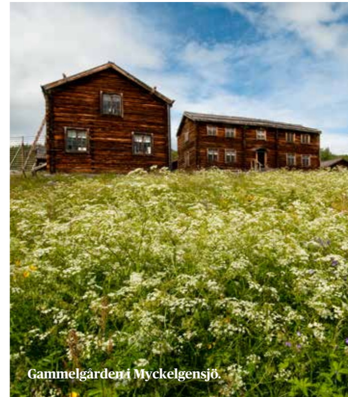
Gammelgården i Myckelgensjö.