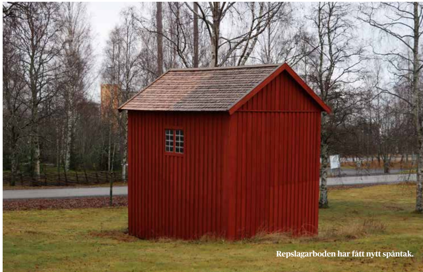
Repslagarboden har fått nytt spåntak.