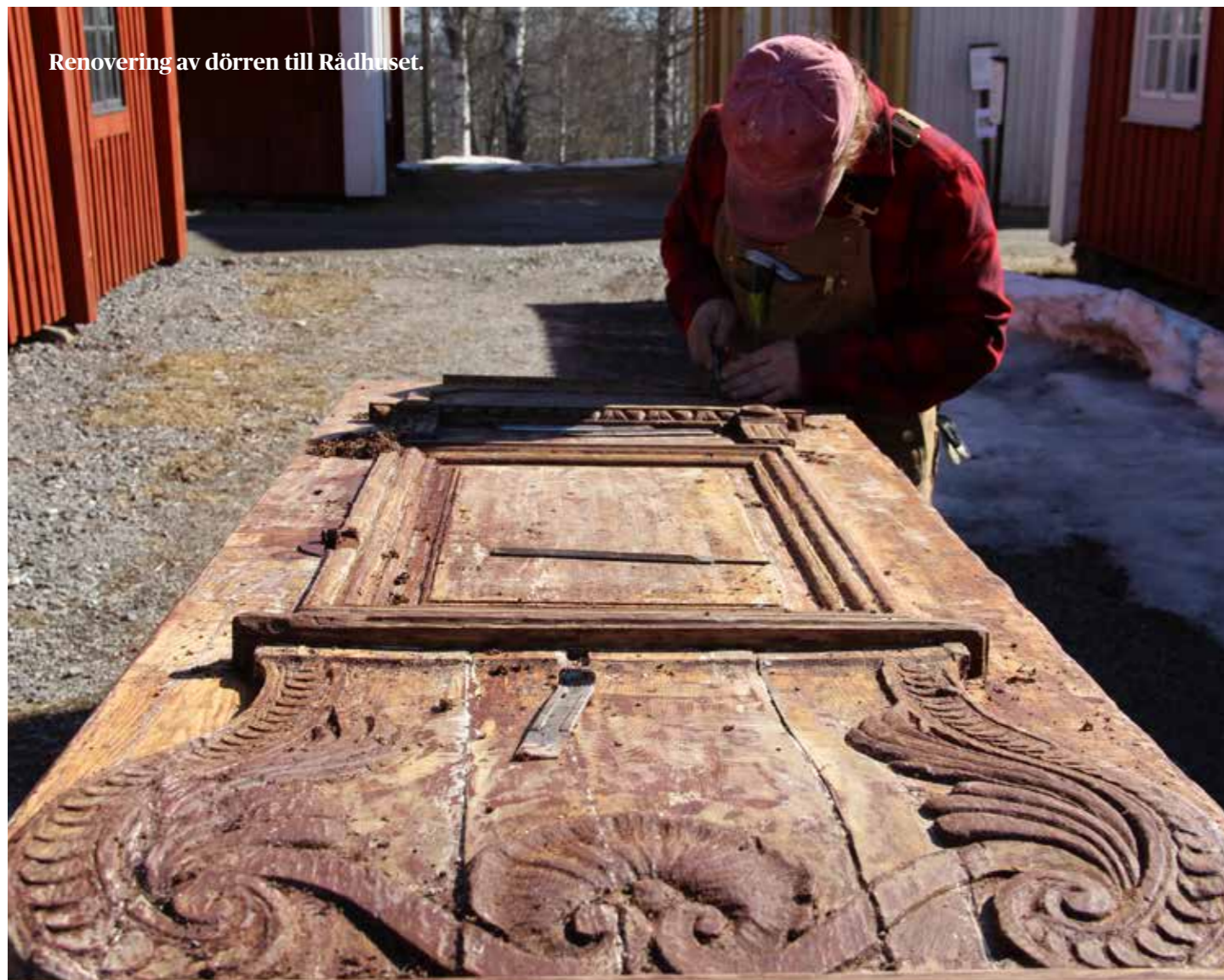
Renovering av dörren till Rådhuset.