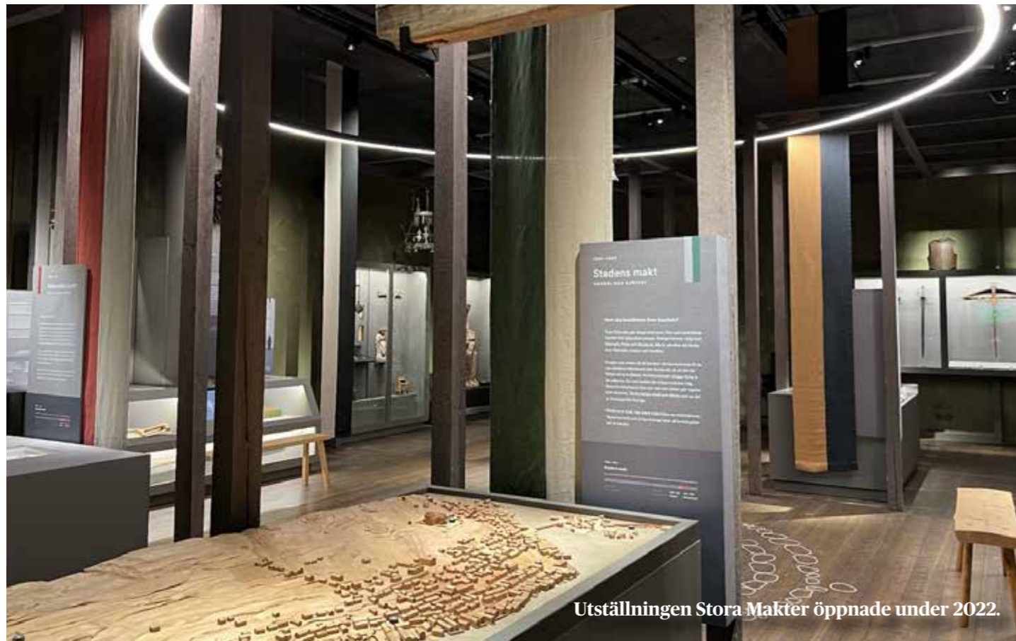
Utställningen Stora Makter öppnade under 2022.

Samtidigt som dessa utmaningar är stora, ser vi också många verksamhetsområden där stiftelsen tagit många utvecklingssteg framåt och där verksamheten kommer att fortsätta utvecklas. Länsnärvaron och kunskapsförmedlingen inte minst genom de nya basutställningarna, det regionala kulturmiljöuppdraget, den digitala utvecklingen för att stärka möjligheterna till relevant kunskapsuppbyggnad och kunskapsförmedling, arbete för miljömässig och social hållbarhet, de viktiga projekten för regional utveckling, arbetet tillsammans med nationella minoriteter - allt detta ger gott hopp framåt och ökar museets samhällsrelevans.