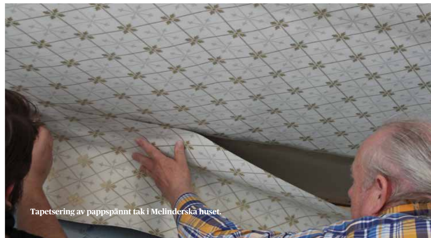
Tapetsering av pappspännt tak i Melinderska huset.