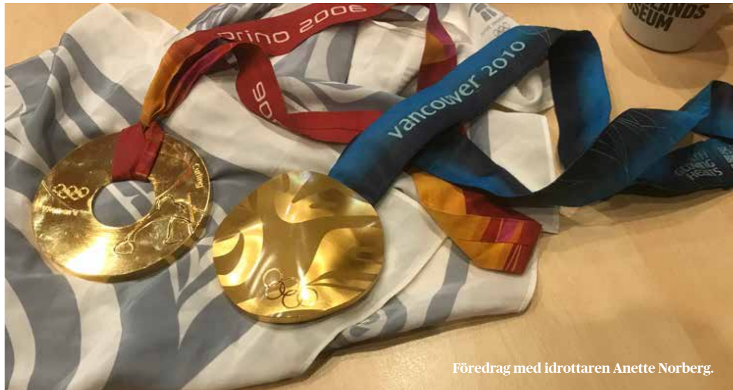
Föredrag med idrottaren Anette Norberg.