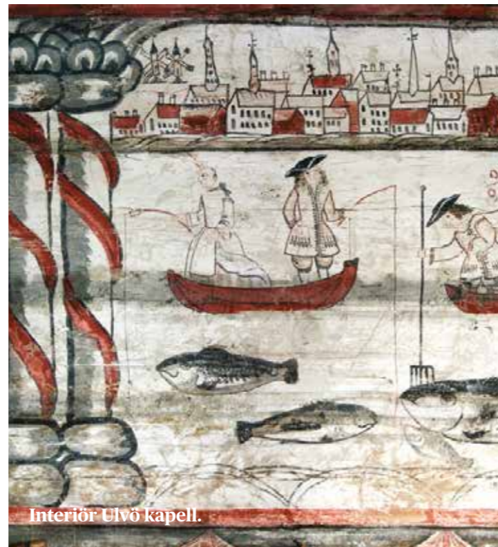
Interiör Ulvö kapell.