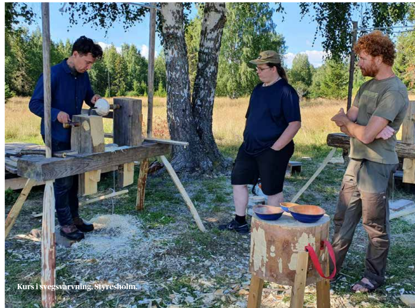
Kurs i svegsvarvning, Styresholm.

Uppropet Sticka för fred . I samband med Cirkus Cirkörs föreställning Knitting Peace uppmanade hemslöjdskonsulenter i samarbete med Riksteatern till att Sticka för fred . Vantar med egendesignade fredsbudskap stickades av hemslöjdsföreningar och enskilda stickentusiaster. Flera gemensamma stickträffar arrangerades av olika aktörer på offentliga platser, bland annat i Birsta varuhus. 50-talet fredsvantar från regionen visades både i Tonhallen i Sundsvall och på Västernorrlands museum under hösten. Via hashtaggen #stickaförfredivästernorrland kunde intresserade digitalt följa processen. Sticka för fred är ett exempel på deltagaraktivitet som lockar många att delta och att också ta egna initiativ. Spontana mötesplatser, både digitalt och IRL, uppstår som i sin tur skapar nya möten och sammanhang.