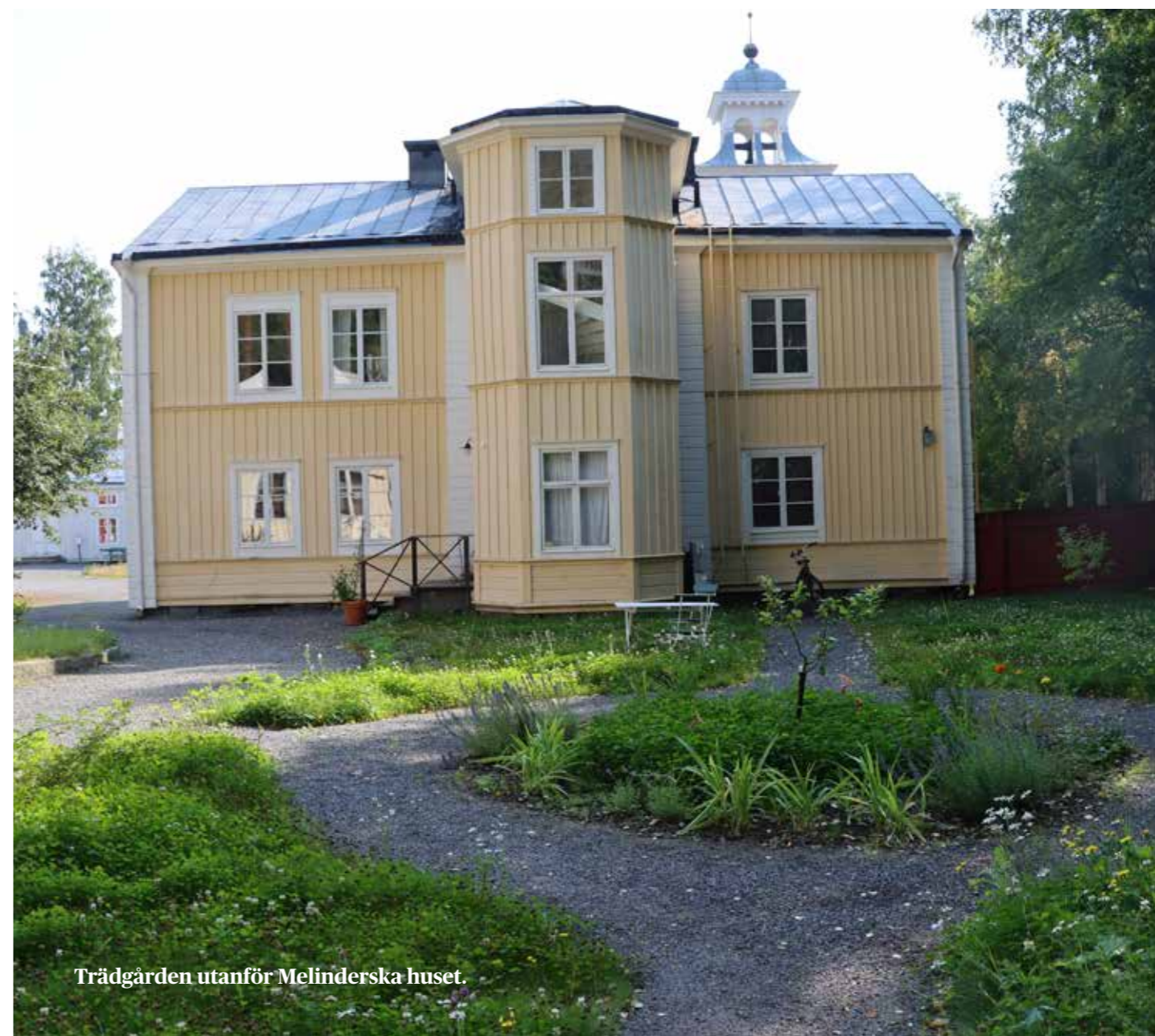
Trädgården utanför Melinderska huset.

Samarbetet med Träakademien har fortlöpt och är en ovärderlig del i det långsiktiga arbetet med att restaurera miljöerna på Friluftsmuseet. Både museet och Träakademien ser möjligheter till vidare utveckling. I princip hela ommålningen av Hellströmska huset gjordes av sommaranställda studenter från Träakademien och två studenterna förlade sina examensarbeten till friluftsmuseiområdet. Ett av dessa examensarbeten resulterade i att Repslagarbodens hela spåntak lades om och det andra i att ett av museets äldre upplag med foder och lister sorterades och inventerades. Delar av denna inventering