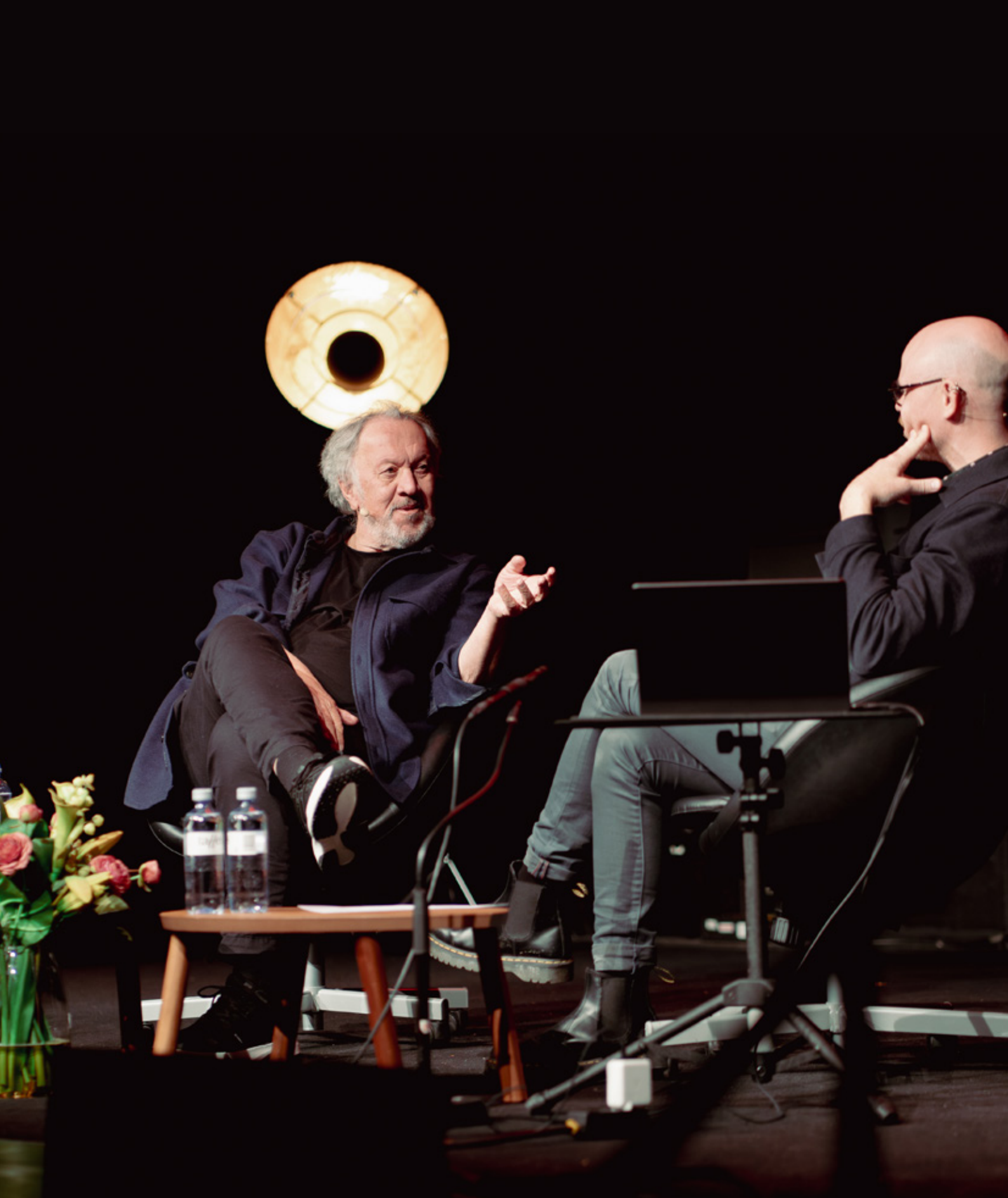
Bjørn Eidsvåg, Hall of Fame.