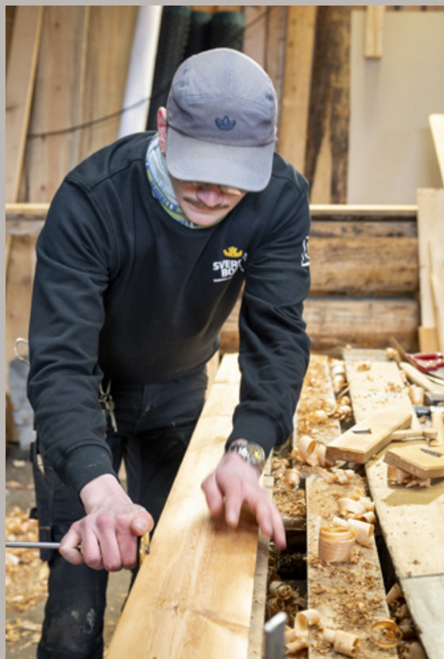
Sverresborg, restaurering av Hans Nissen-gården.

Museene er arenaer for samtaler og debatt, de er møteplasser for folk med felles interesser, for sosiale sammenkomster og for viktige markeringer i menneskers liv, samt at de naturligvis også er arenaer for annen kulturell aktivitet som teater og konserter. Møteplassfunksjonen kan utøves på ulikt vis, og publikumstall for totalbesøk viser at museene har en utvidet funksjon utover kjernevirksomheten. I 2024 har det vært avholdt 542 ulike arrangementer ved museene i MiST.