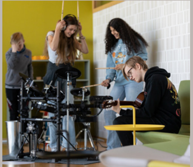
Musikkhagen på Ringve.

MiST samarbeider internt gjennom en markedsgruppe bestående av én person fra hvert museum som jobber med markedsføring, samt markedsrådgiver hos Utviklingsenheten. Alle museene i MiST skal framsnakke og markedsføre hverandre. Det arbeides med å kartlegge og analysere målgrupper for å spisse markedsføringen. Museene samarbeider med sine lokale reiselivs- og destinasjonsselskaper.