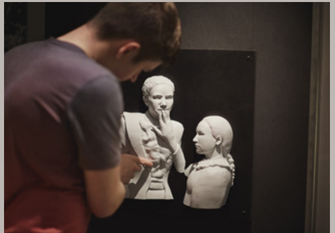
Norsk Døvemuseum.