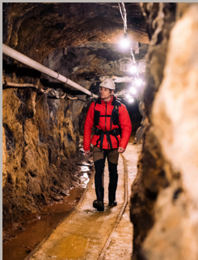
Rørosmuseet, Olavsgruva.