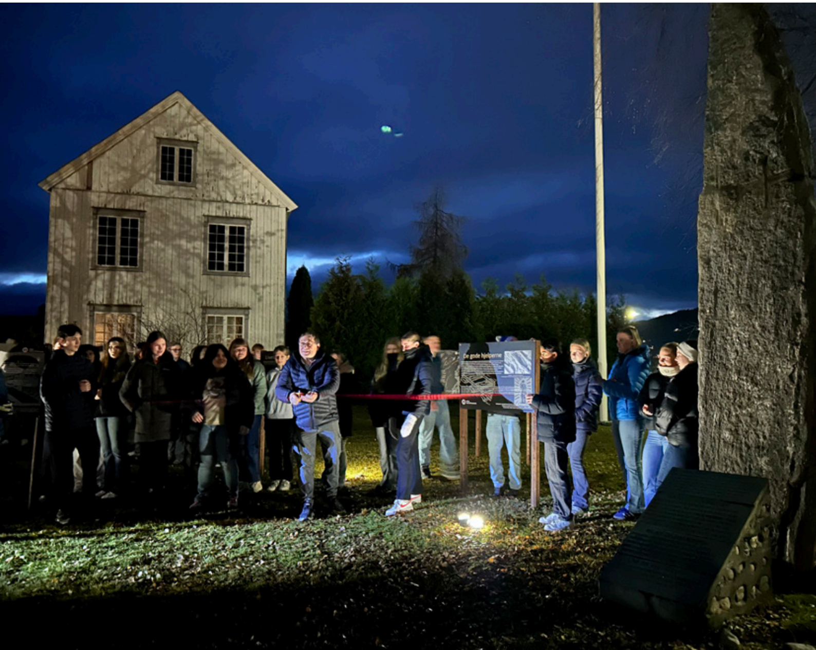
Åpning av utstilling på Grøtte.