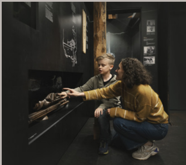
Orkla Industrimuseum.