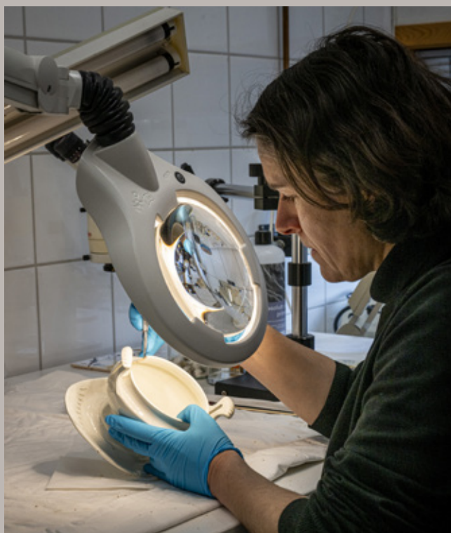
Konservator ved Sverresborg.