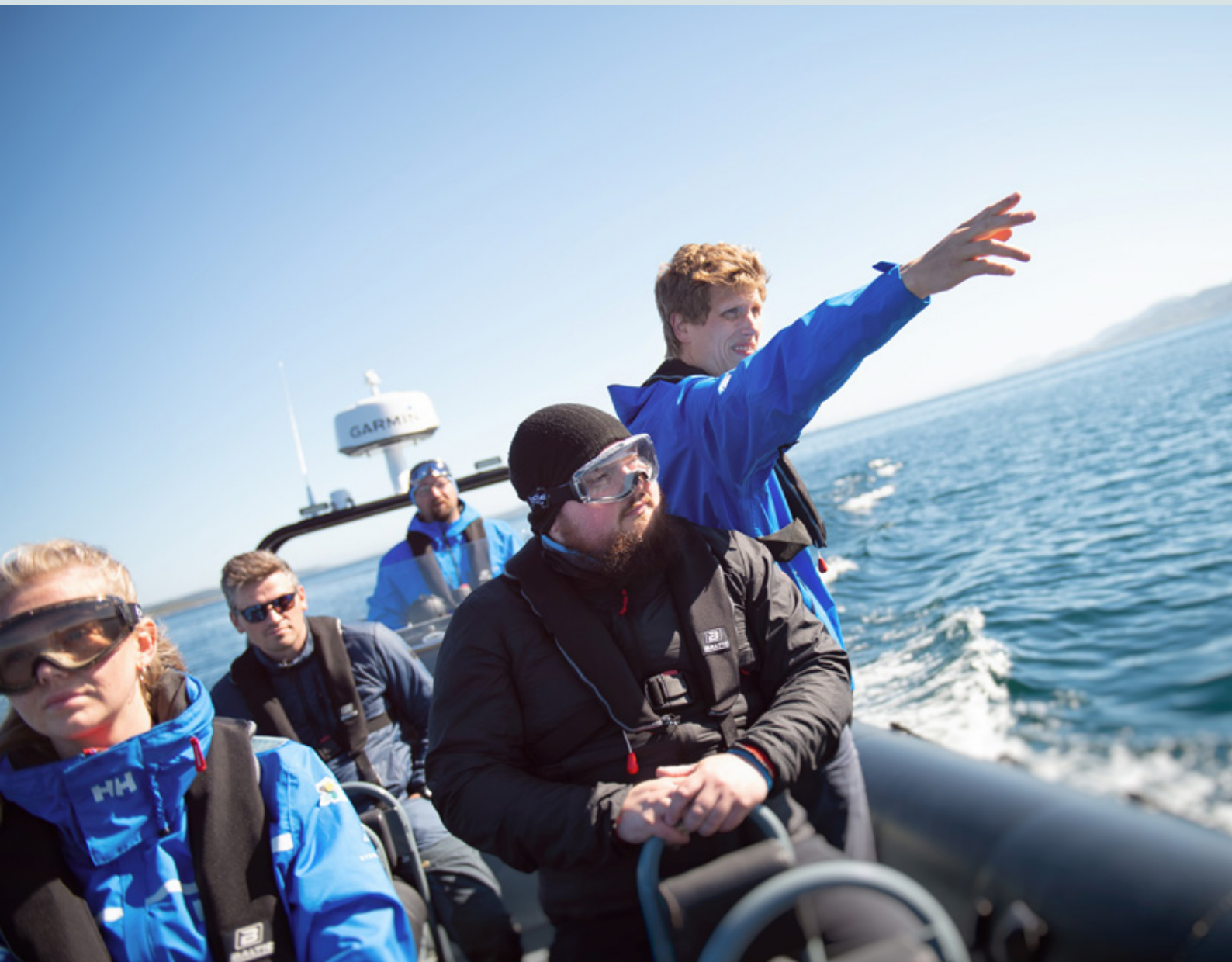
Formidling ved Kystmuseet.

Vi forteller historien, utfordrer samtida og preger framtida!