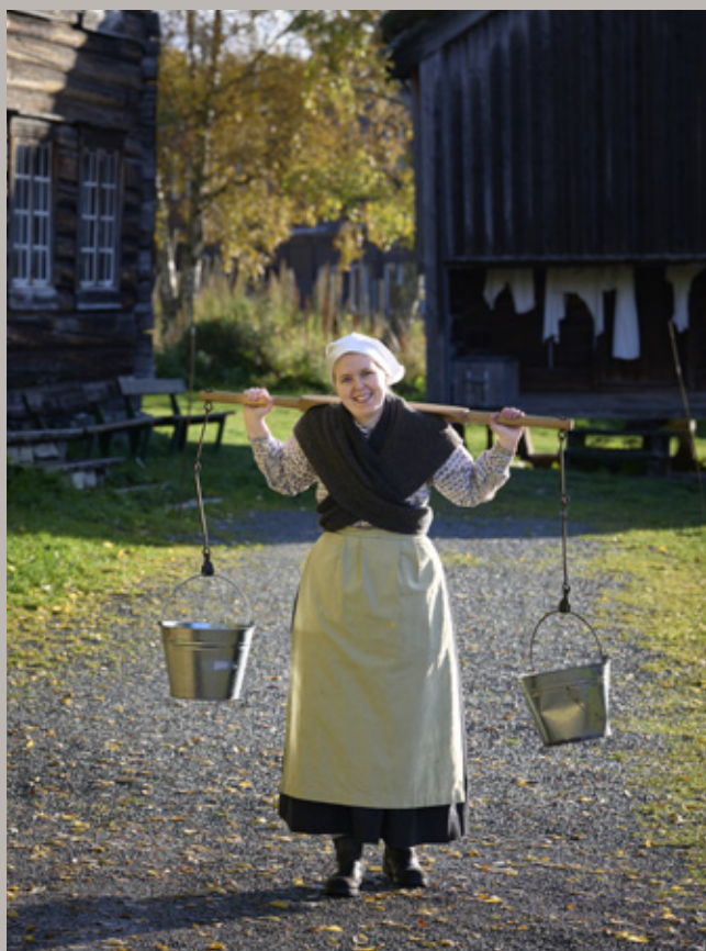
Sverresborg Trøndelag Folkemuseum.