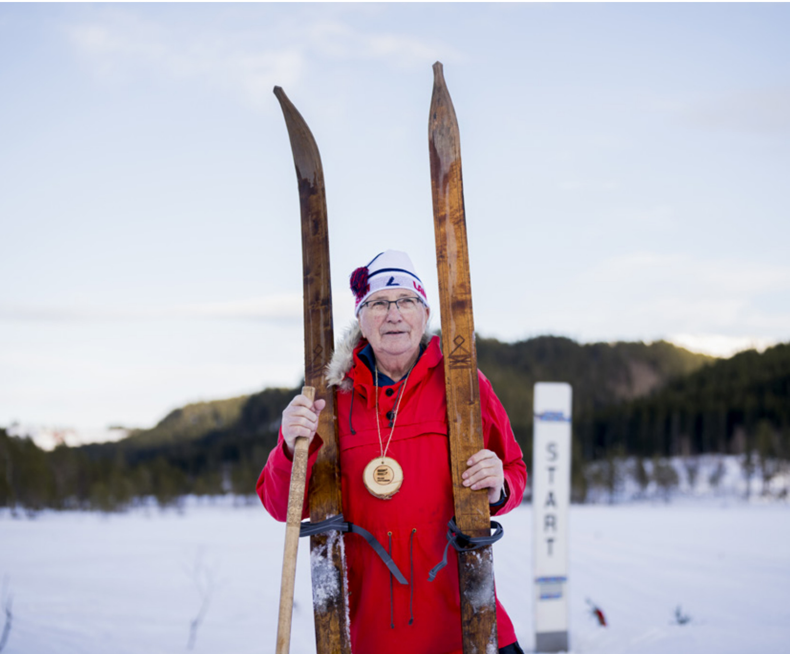
Gaukrenn ved Rindal skimuseum.