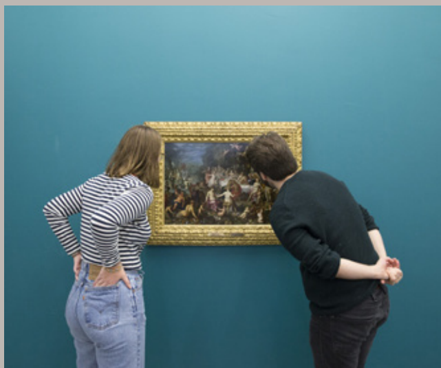
Trondheim kunstmuseum.