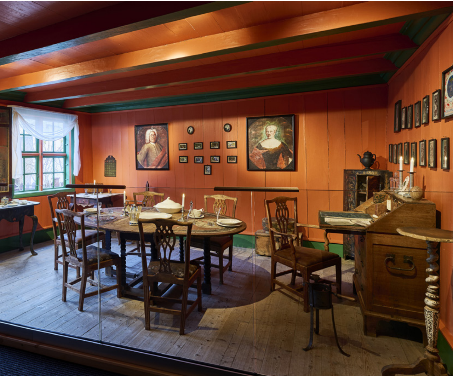
Hans Nissen-gården.