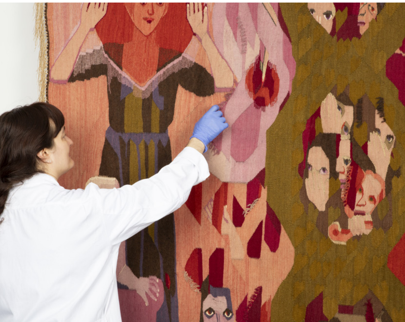
Tekstilkonservator arbeider med Hannah Ryggen-teppe på Nordenfjeldske Kunstindustrimuseum.