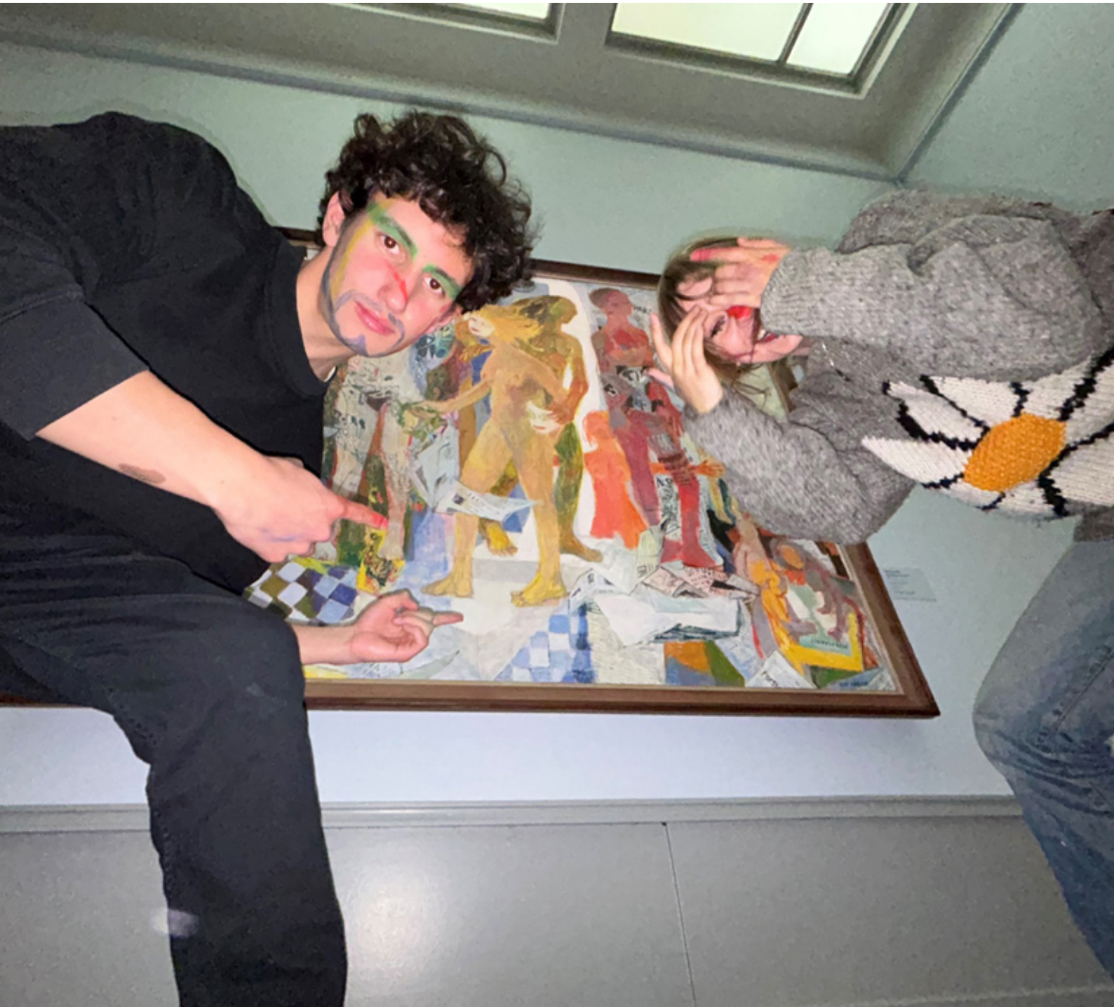
Unge skapere.