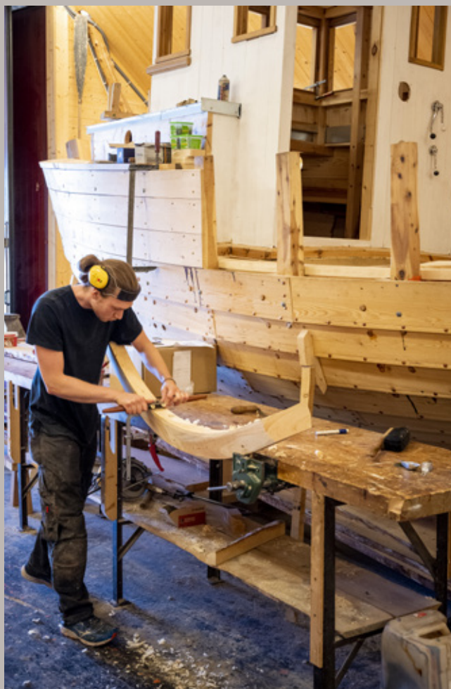
Båtbyggeriet på Museet Kystens Arv.