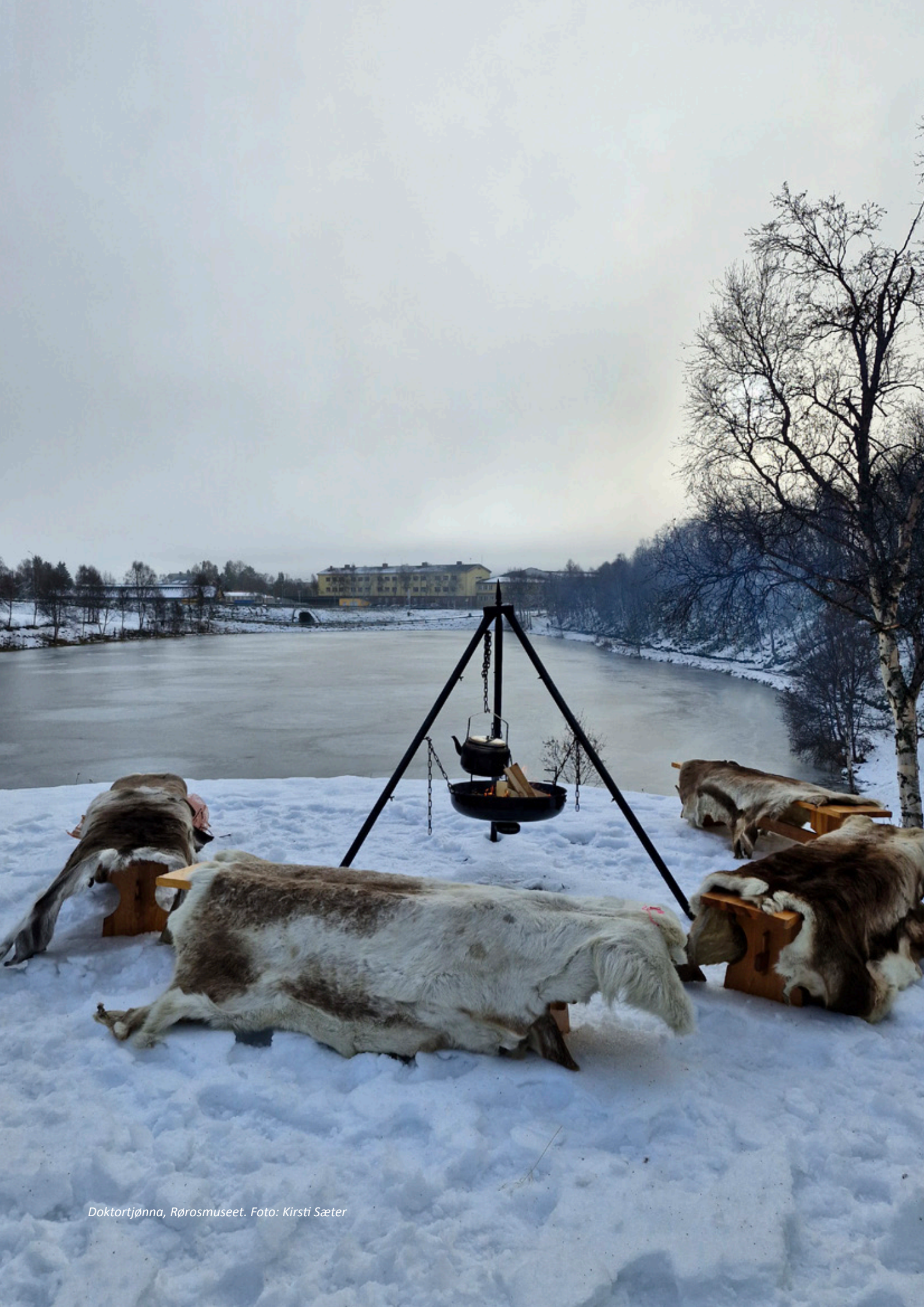
Dokortjønna, Rørosmuseet.