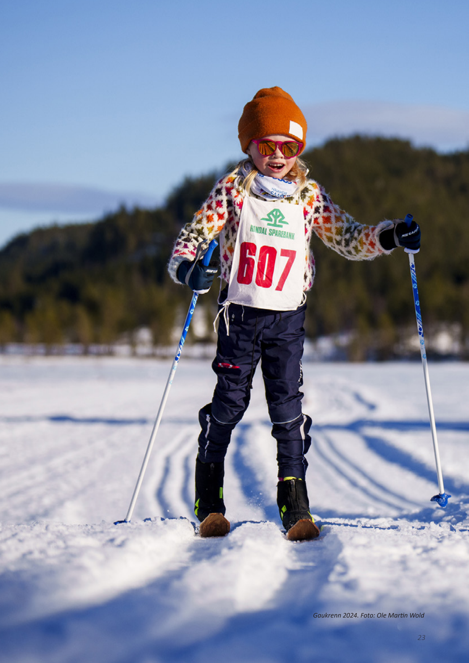
Gaukrenn 2024.