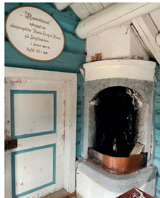
Tømmerstua eller «dikterstua» slik den framstår i 2022.