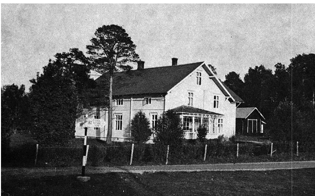
Skogly, gnr. 40, bnr. 50 sett fra vest. Foto omkr. 1935.