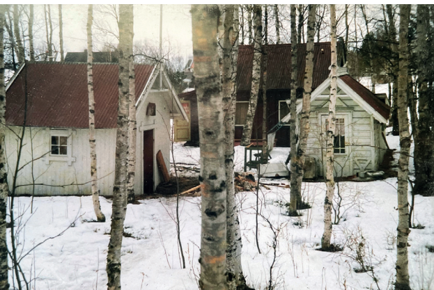
Bilde av husa fra 1950-60-tallet, kanskje tatt enda senere.

På et fargebilde som henger inne i «dikterstua», kan vi få et inntrykk av hvordan det så ut på 50-60-tallet, da husa ble brukt til barnehage. Vi ser at stasjonshuset har fått påbygg, mens huset til venstre ikke står der lenger, men er erstattet av et nytt bygg som er dreid 90 grader og har fått sveitserdekor på mønet.