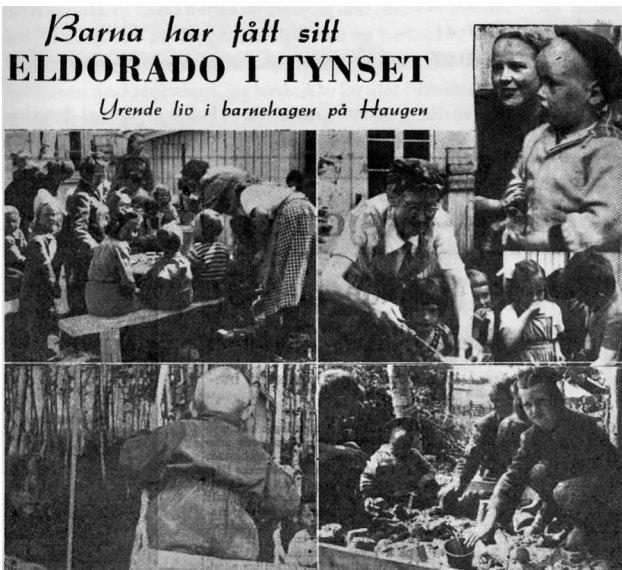
Bilde fra Østerdølen 29. juni 1950.

Om det er Østerdølen eller Arne Dag som gir det sanne bildet av barnehageprosjektet, er vanskelig å vite, men en av «rysspiltene» som vi har snakket med over 70 år senere, mener å minnes at han motvillig ble