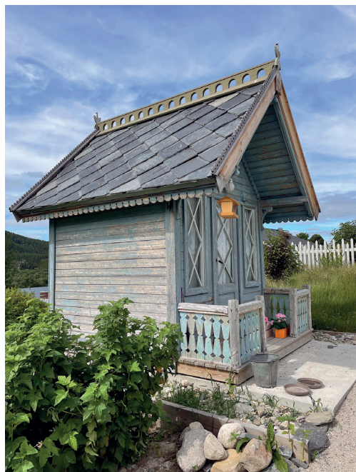
Nyrestaurert lekehus ved Steien hotell.

Minst like interessant er spørsmålet om hvorfor et slikt lite hus ble oppført i stasjonsparken? Et tilsvarende lite hus ble oppført på Alvdal stasjon og er nå bevart ved Steien hotell. Var dette en del av stasjonsbebyggelsen – et hus for spesielle