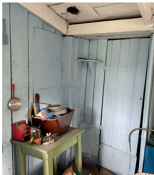
Kjøkkenkroken slik den ser ut i 2022, med tydelig hull etter piperør.

Vi vet ikke, men mye tyder på at stasjonshuset ble påbygd for å utvide fasilite-