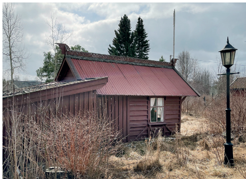
Stasjonshuset med tverrstilt påbygg slik det ser ut i 2022.