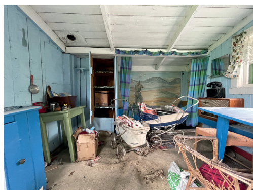
Inne i «stasjonsdelen» og innerst i «påbygget» i 2022.