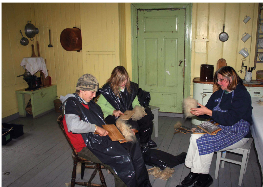
Skoleaktiviteter i Museumsparken, Tynset Bygdemuseum.