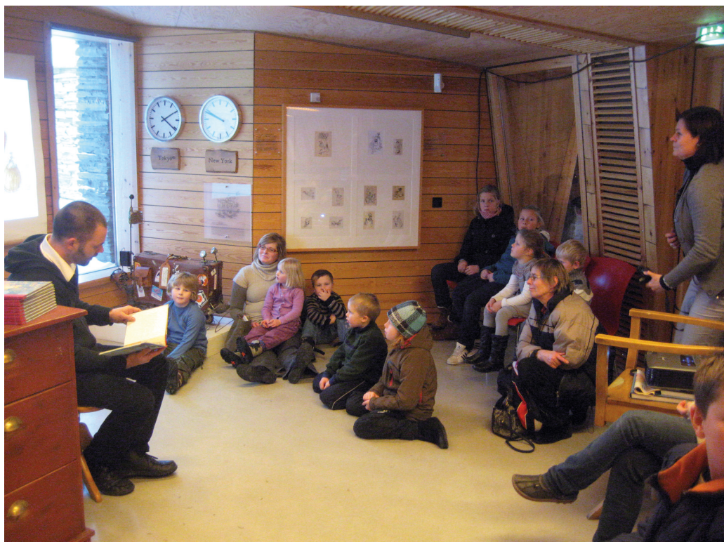
Barneboklansering på Aukrustsenteret.

dokumentasjon, dessuten bilder knyttet til bokproduksjonen.