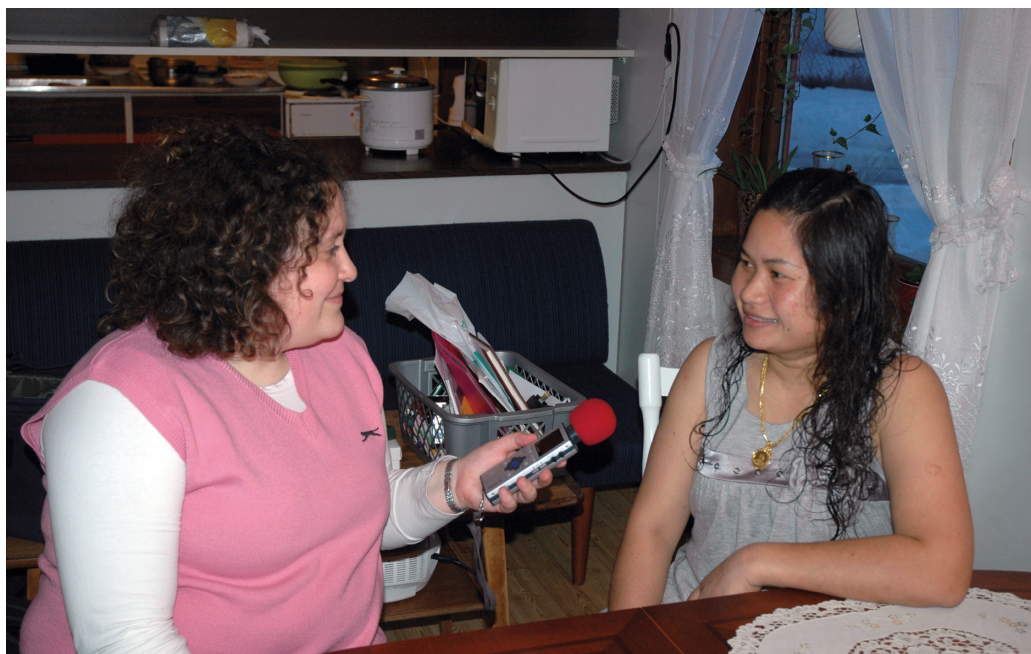
Innsamling av bakgrunnsmateriale til utstillingen Innvandrerportrett fra Nord-Østerdalen.

Det er utarbeidet forslag til nytt toalett- anlegg på Bjørgan (servicebygg).