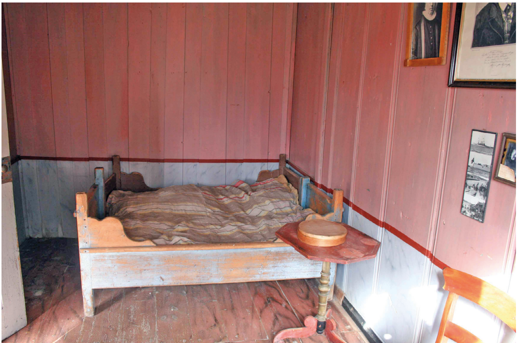
2010 er det 100 år siden Bjørnstjerne Bjørnson døde. Bjørnsonbygningen på Bjørgan skal gjennomgå en omfattende restaurering. Statsbygg har det bygningstekniske ansvaret, mens Nordøsterdalsmuseet er pådriver.