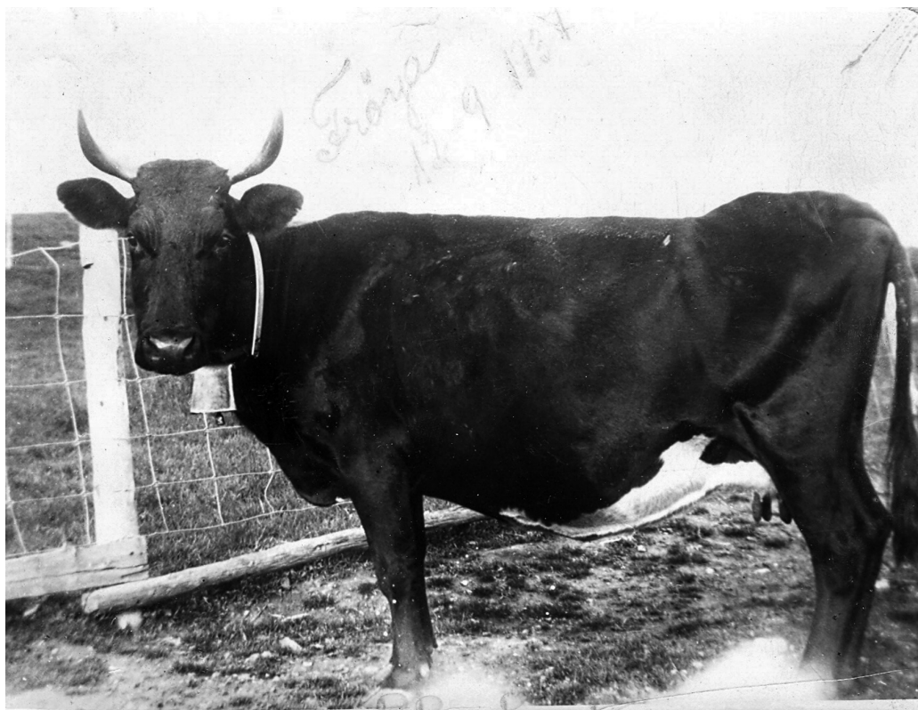
Dølakua Frøya fra 1927.