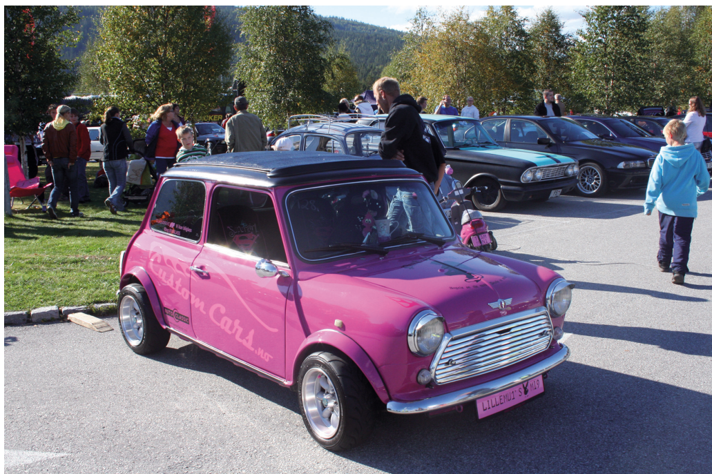
Populært innslag på Gatebiltreffet på Aukrustsdenteret.

I tillegg har det også vært mange henvendelser fra eiere i andre sammenhenger, kommet med råd og anbefalinger, laget vurderinger. Ca 50 steder er befart.