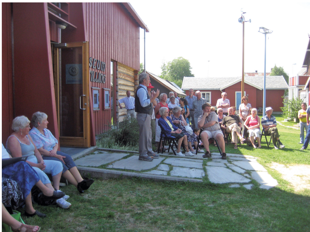
Åpning av utstillingen Innvandrerpportrett fra Nord-Østerdalen, publikum samlet ute på tunet på Museumssentret Ramsmoen.