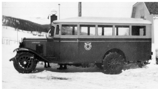
A. og O. Hokstads buss fra 1930. Karosseriet er laget av Tyldal Snekkerverksted. Bussen gikk i rute Tyldalen–Tynset.

Om våren var det ikke så liten pågang etter mjølkholker (store trestamper) for oppbevaring av tettmjølk (kjellermjølkk).