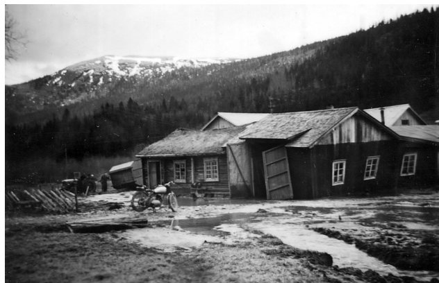
Det går mot slutten for snekkerfabrikken.