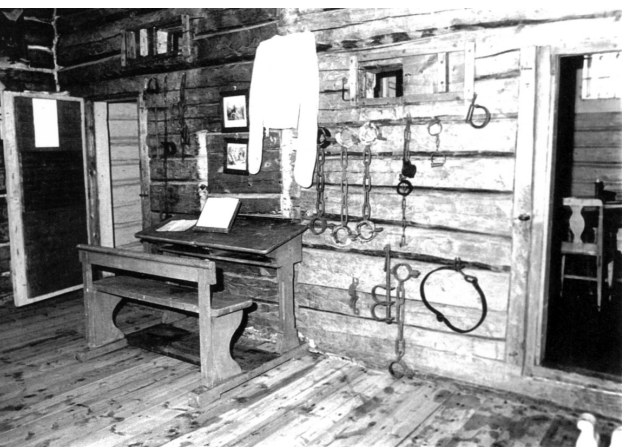
Fra gangen mot cellene

høyde. Dette skyldes antakelig en vurdering av fangenes «farlighetsgrad», da maten til fangene fra lensmannskjøkkenet ofte måtte leveres av tjenerskapet, og i enkelte tilfeller også av de eldste barna på garden. Da kunne det kanskje være en sikring å ha en viss avstand fram mot matbrettet, som ble levert til fangen inne i cella?