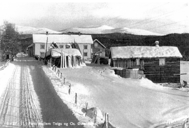
Lensmannsgarden, med arresten og smia. Riksvegen er seinere.

Selve arrestbygningen er en frittliggende, laftet tømmer bygning i to etasjer fundamentert på solide gråstensmurer og tekket med torvtak.