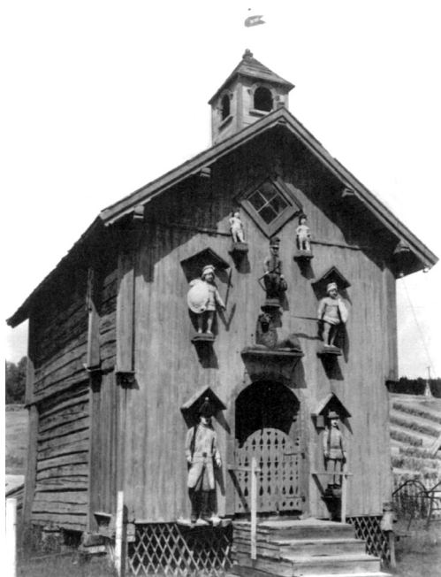
Stabburet med figurer, ca. 1950