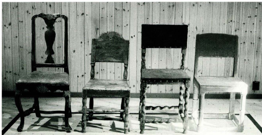
Fra møbelutstilling på Museumssenteret Ramsmoen