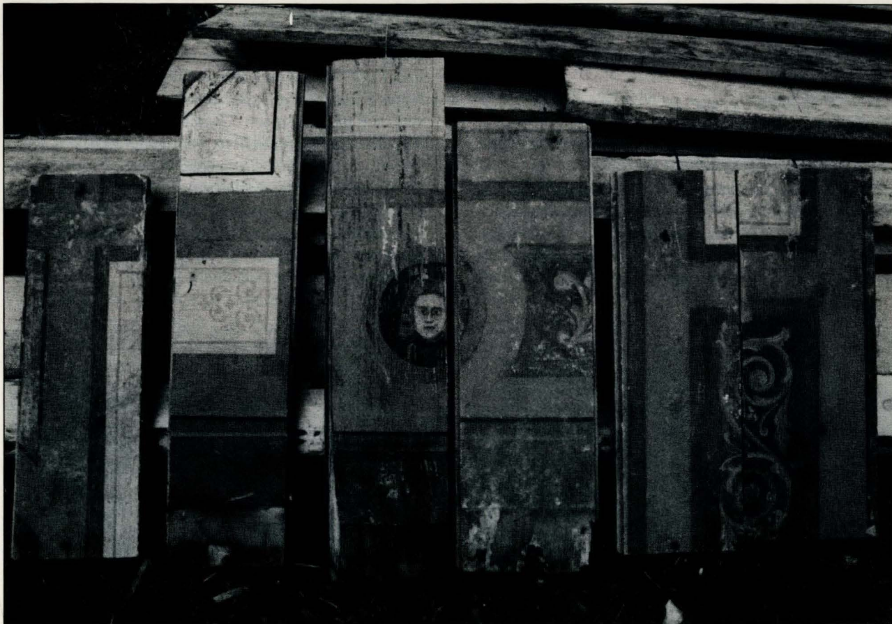
Under restaurering på Vollan kom det fram en del gammel panel, med spennende sjablongmaling, brukt som taktro ved forskjellige ombygginger på 18- og 1900 tallet. (69787)

Vi har løpende kontakt med landbruksmyndigheter når det gjelder midler over jordbruksoppkjøret til kulturlandskap og verneverdig bebyggelse