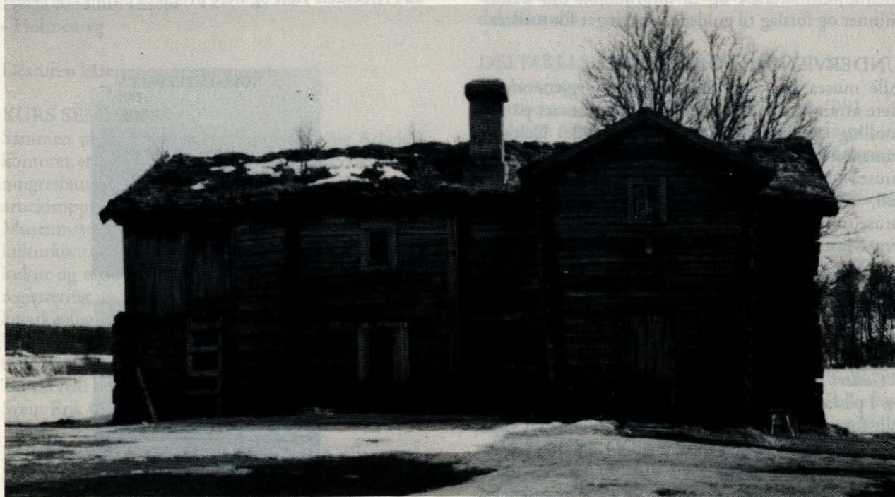
Gammelbygningen i Smegarden, Midtdal, Tufsingdal, to-etajes bygning med barfrøloft, utgangspunktet har vært ei østerdalsstue, som er påbygd etter behov.

Arbeidet med kulturlandskap og byggeskikk i Vingelen har fortsatt, med vegledning og utarbeidet grunnlag for studievirksomhet, utgitt rapportene: Hus i Vingelen og Byggeskikk i Vingelen . I prosjektet om Utskifting i bygda Tynset har vi bidratt med bakgrunnsmateriale, gjennomgang av byggeskikk og kulturlandskapselementer. Byggeskikkundersøkelser i