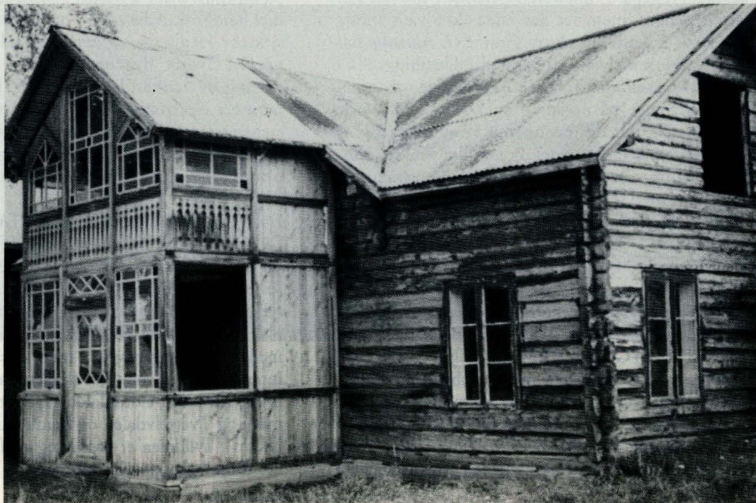
Tronsmohuset under riving, legg merke til den fine glassverandaen.

Ved alle museer har det vært drevet vedlikeholdsarbeid og videre utbygging, utført av det enkelte museum. Museumssentret har vært engasjert i varierende grad. Konservatoren er bestyrer ved Tynset Bygdemuseum og det er nedlagt mye arbeid med den videre utbygging av Tynset Bygdemuseum, Museumsparken . Motrøbygningen er ferdig, stall fra Løkken nesten og arbeidet med Tronsmohuset har kommet langt. Det er delvis utarbeidet ny plan for utbygginga av Museumsparken, målet er å være nærmest ferdig til 1993, museets 70 års jubileum. Sammen med Hjemmevernet arbeides det med å samle gjenstander fra siste krig, Klengstua på Tynset skal flyttes til Museumsparken og være utstillingslokale og samlinga skal dekke hele Nord-Østerdalen og