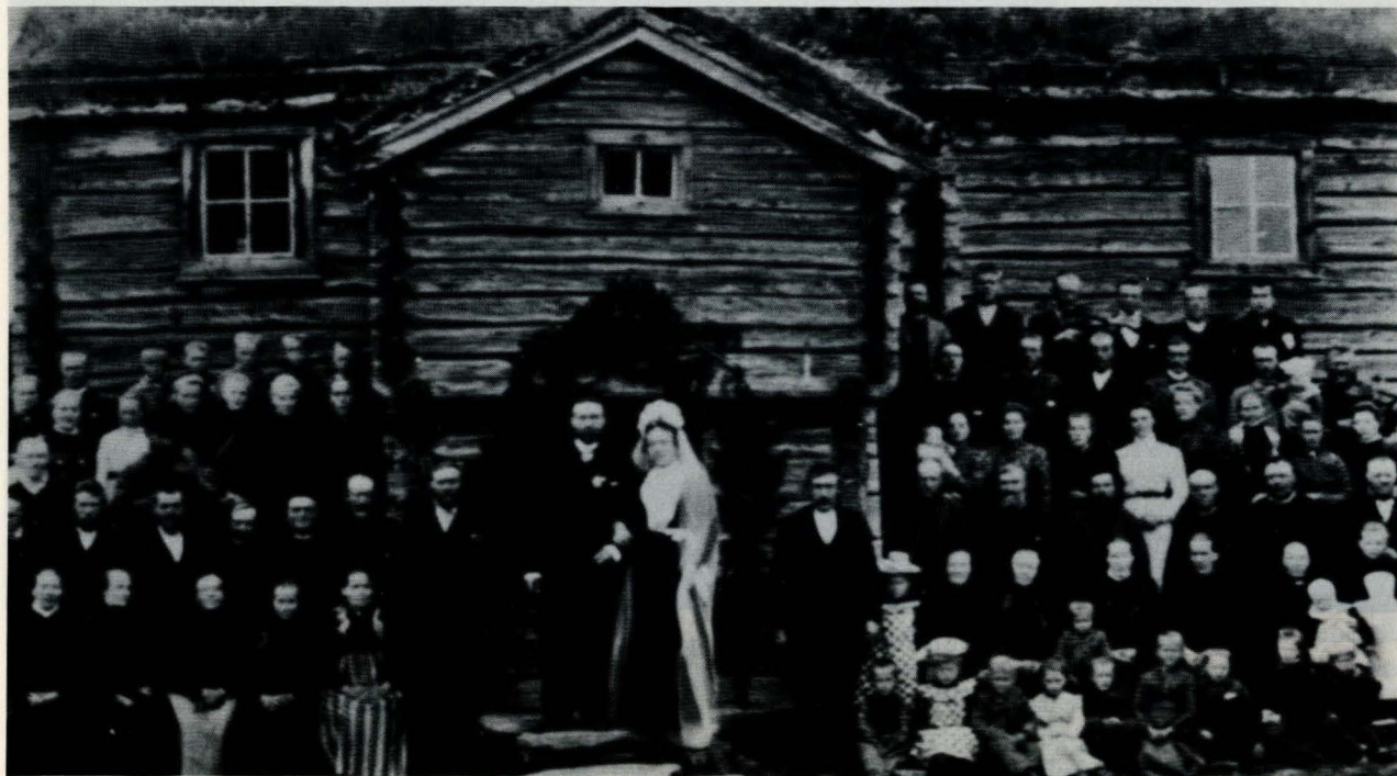
Fra bryllup, Bakken østre, Summundbakken, Tufsingdalen, 1911, legg ellers merke til at bygningen har barfrøloft.

Det er arrangert fotodag i Folldal, i Grimsbu. Den store innsatsen med fotobevaring skyldes fotobok for Rendalen og Folldal, dessuten fotografier til boka Liv og lagnad i Strømmengrenda. Til utstillingen om Bardu-utvandringa ble det også samlet inn mye bilder. Ellers er det fremdeles stor tilgang på gamle verdifulle bilder. Gjennom ulikt dokumentasjonsarbeid er det også fotografert mye: 2964 svart/hvitt opptak og 2133 lysbilder, mye av dette knytter seg til arbeidet med byggeskikk. Museumssentrets samlede negativmateriale er svært omfangsrikt. Arbeidet med å legge opplysninger inn på data er fortsatt i startgrope, bare ca. 1000 av ca. 80.000 bilder er til nå lagt inn på data.