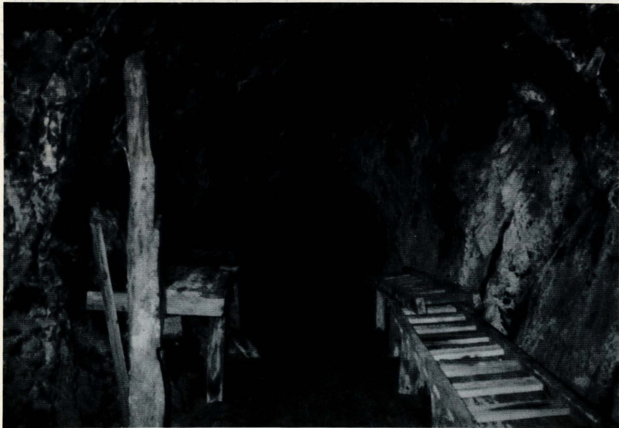
Fra Stoll I, Follidal Gruver, som brukes som besøksgruve.

tatt i bruk. Vi har skaffet oss kopier av oppmålings-tegninger mm fra Riksantikvarens Arkiv. Emnearkivet er bygd ut og inneholder nå mye viktig informasjon.