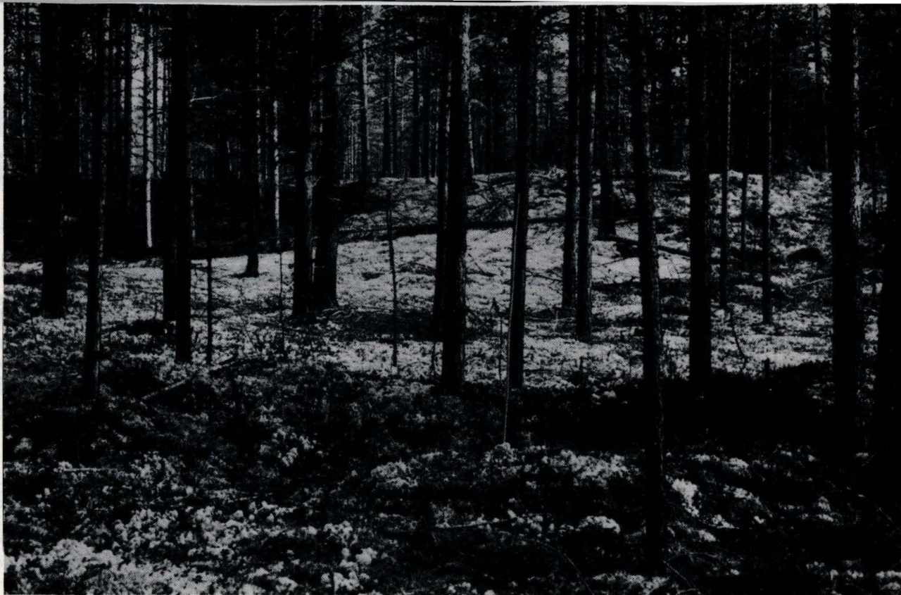
Eidsmoen består av furu og reinmose, i flatt terreng men med flere terrasser. Kulturminnene ligger særlig i forbindelse med terrassene.

jern fra slike anlegg som her på Eidsmoen.