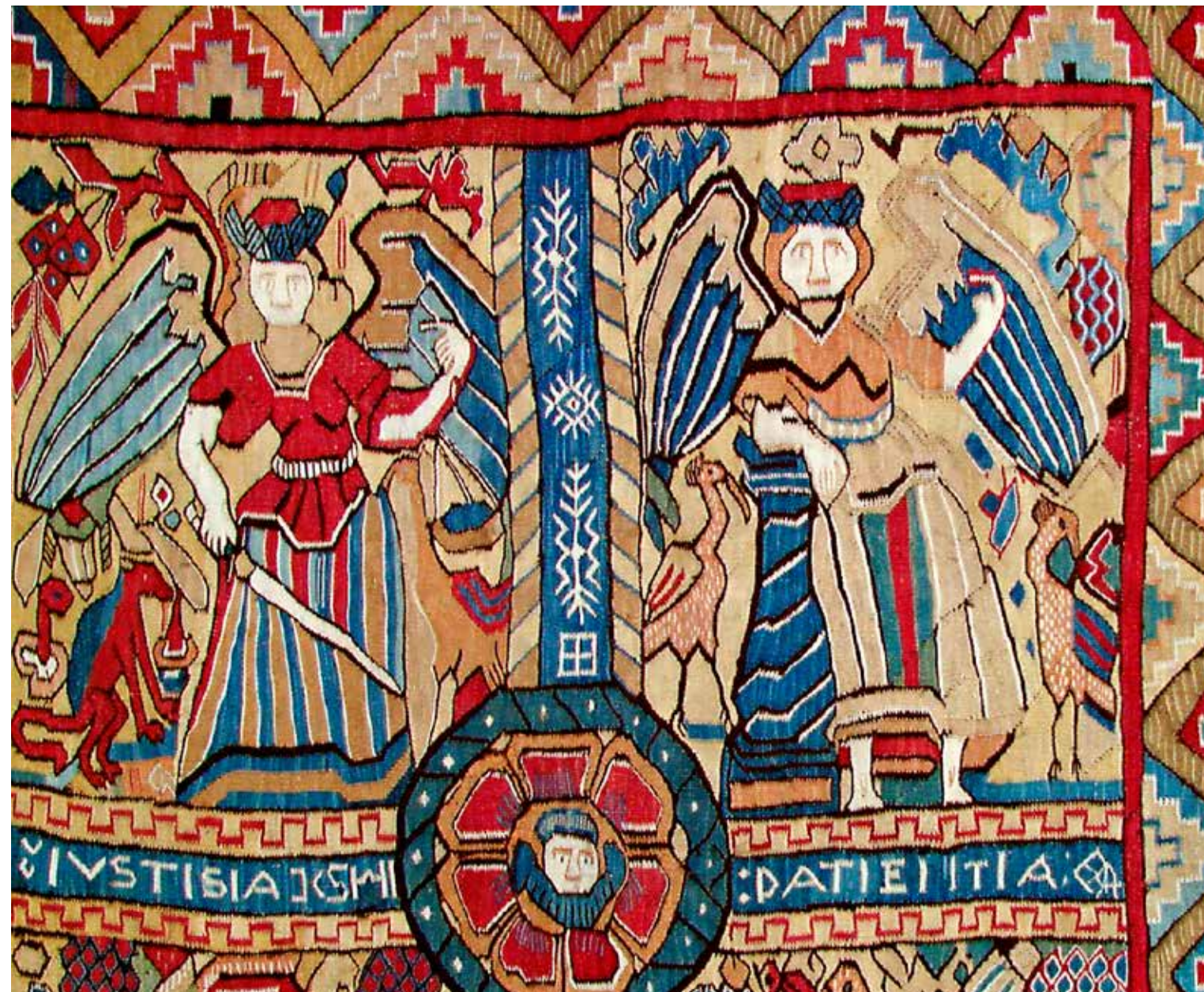
Detalj fra billedteppe som viser de to dydene justitia og patientia, rettferdighet og tålmodighet. Tålmodighet er et bilde på kampen mot lastene og har ofte et lam (Agnus Dei, Guds lam) ved sin side. Den hører egentlig ikke med til de syv dyder, men var likevel et populært motiv både i kirkekunst og folkekunst. På flere billedtepper er tålmodighet på samme måte satt sammen med rettferdighet. Kanskje appellerte disse to dydene særlig til en kvinnelig livsverden?