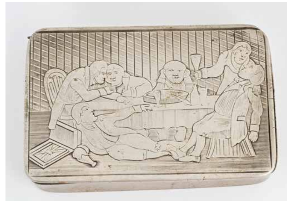
Tobakksdåse i sølv, antagelig fra Tyskland ca. 1800-1810. Dydene kan gi inntrykk av at folk i fortiden var styrt av moral og regler, men scenen på lokket viser et lystig lag som har utviklet seg til et reallt sjøslag.

På bakgrunn av det som her er nevnt, er 1600-tallets Norge og dagens Norge som to