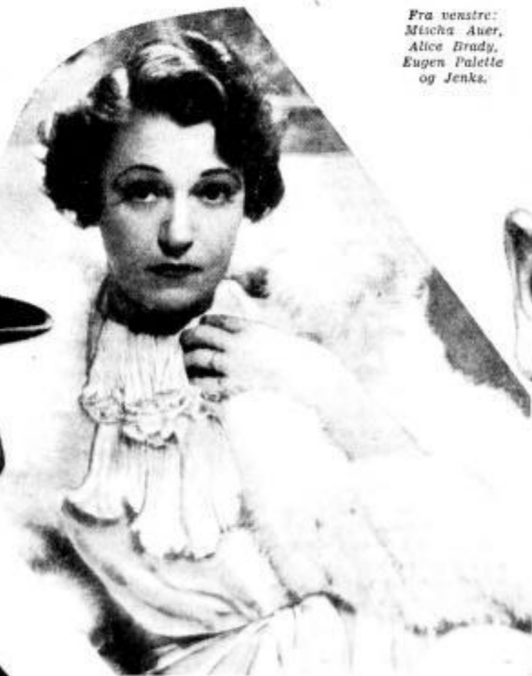
Fra venstre: Mitscha Auer, Alice Brady, Eugen Palette og Jenks.