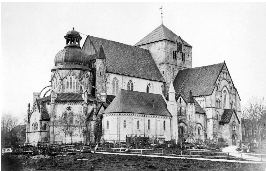
Nidarosdomen, før restaurering.

Hvor hørte Nord-Østerdal til i 1153? De var ikke så opptatt av kirkelige gren-