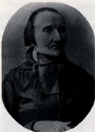
Ill. 5. Frå Tynset, Fåset.