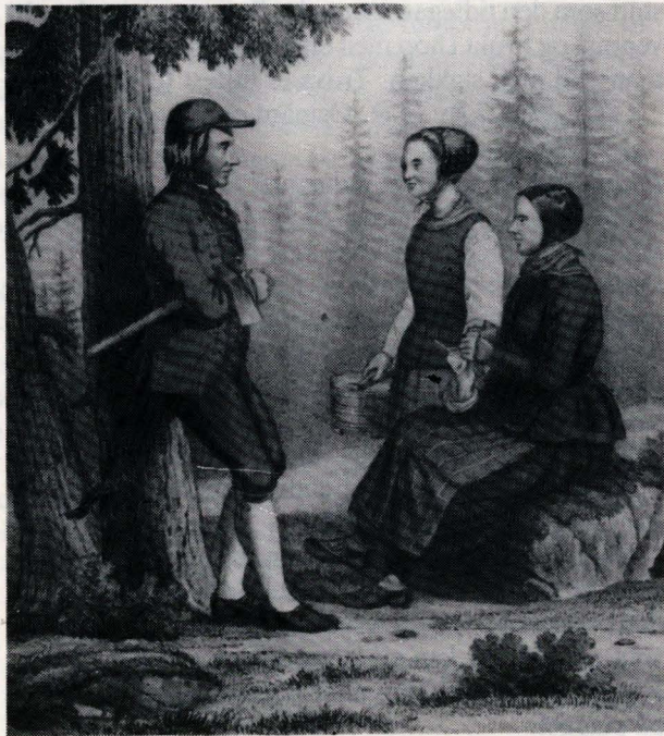
Dragter fra Tønset.

Dersom ein samanliknar våre liv/trøyer med skjøt-liv/trøyer frå andre distrikt, har ein problem med å finne maken. I Sør-Østerdalen finn ein stort sett liv og trøyer med påsydde skjøtar. Ofte er andre liv meir utringa foran enn våre.