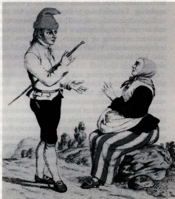
En Mand fra Tønset med sin Kone.