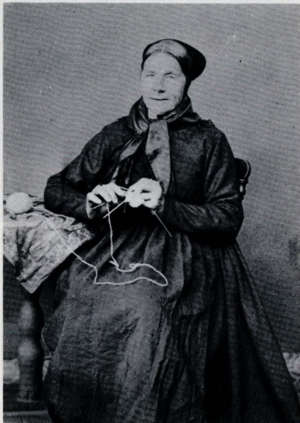
Ill. 8. Frå Tynset, Fåset.