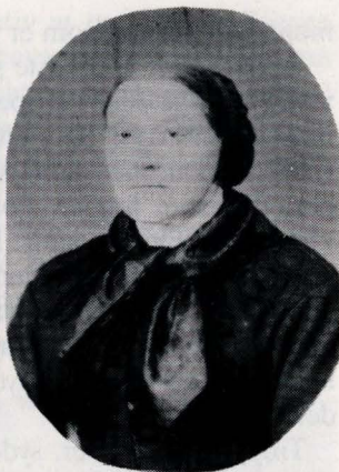
Ill. 6. Frå Os, Narjordet.