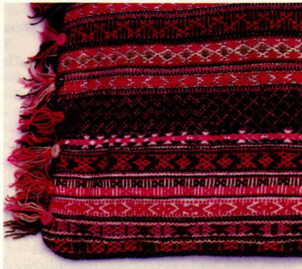
Bilde 8: Langpute 7, banddyne frå Os. Privat eige.