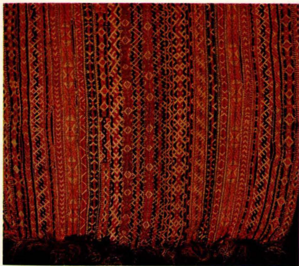
Bilde 12: Langpute 11 (NF 208-19) fra Røros. Eigar Norsk Folkemuseum.