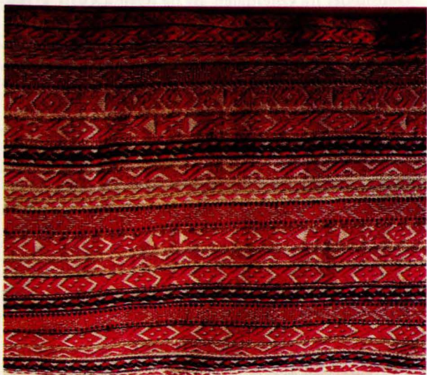
Bilde 13: Langpute 12 fra Os. Privat eige.