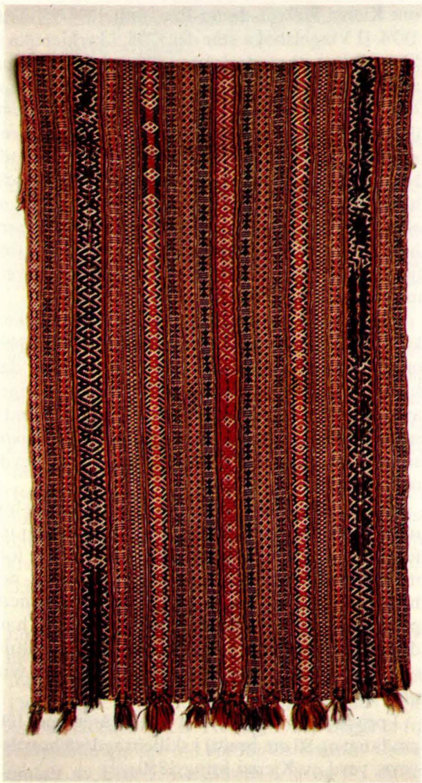
Bilde 1: Langpute 1, trekk (SMT 1900) frå Os/Kvikne. Eigar: Sætersgårds Samlinger, Tolga.