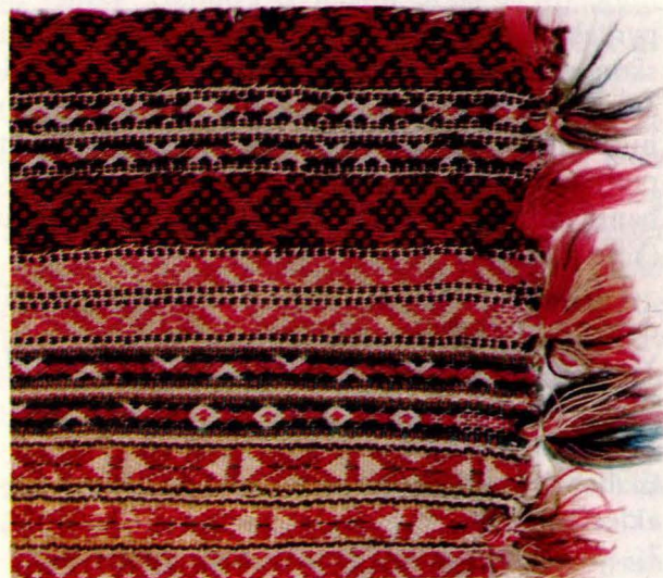
Bilde 5: Langpute 4, trekk frå Tolga. Privat eige.