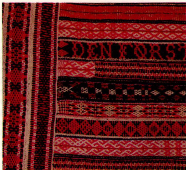
Bilde 2 B: Fellåkle/bandåkle frå Dalsbygda, Os. Detalj. Privat eige.