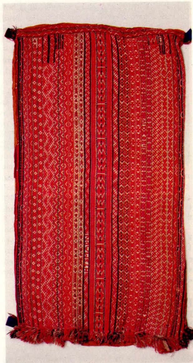
Bilde 11: Langpute 10 frå Narbuvooll, Os. Os Museum.