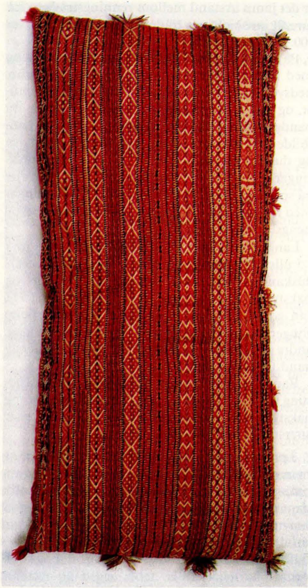
Bilde 3: Langpute 2 frå Dalsbygda, Os. Privat eige.