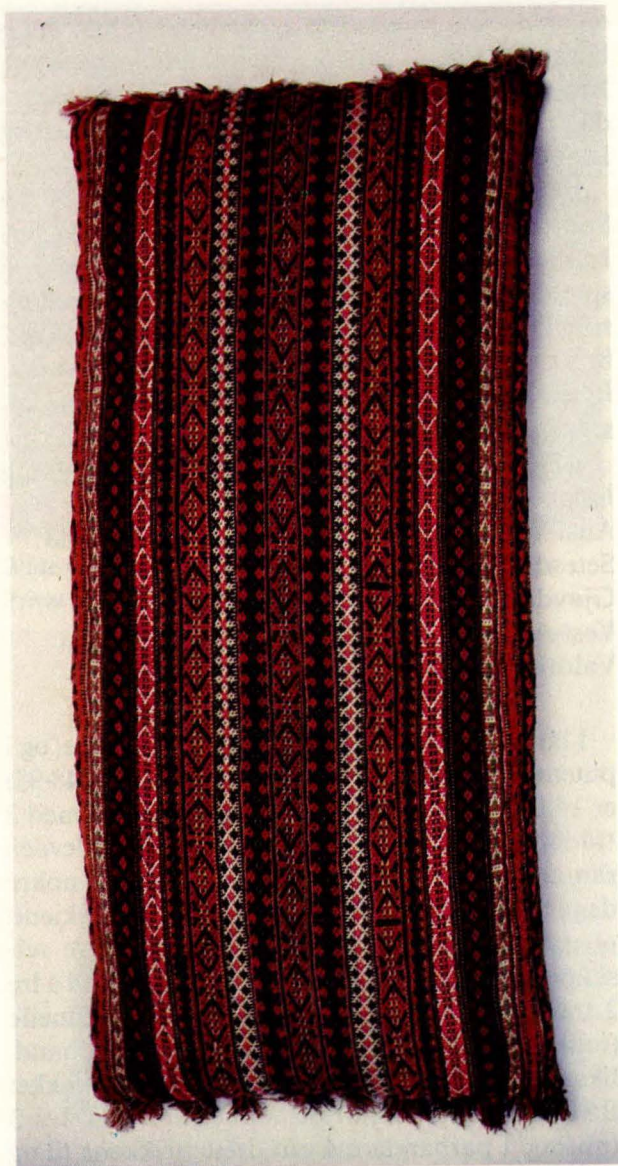
Bilde 9: Langpute 8 banddyne frå Os. Privat eige.