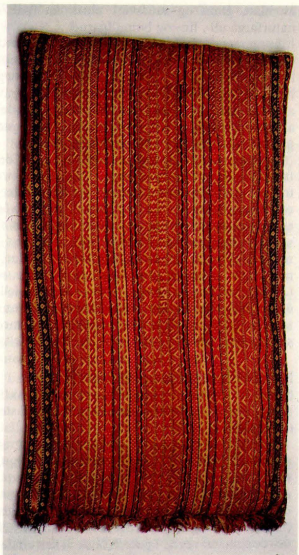
Bilde 4: Langpute 3 (SMT 1901) frå Øversjødalen, Tolga. Eigar: Sætersgårds Samlinger, Tolga.