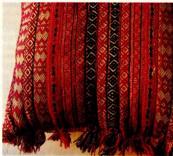
Bilde 14: Langpute 13 (halv) fra Os. Privat eige.