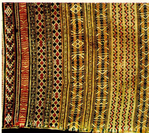
Bilde 15: Putetrek (NF 248-98) fra Flesberg, Numedal. Eigar Norsk Folkemuseum.