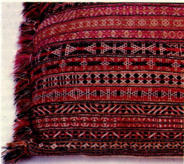
Bilde 10: Langpute 9 frå Vingelen. Privat eige.