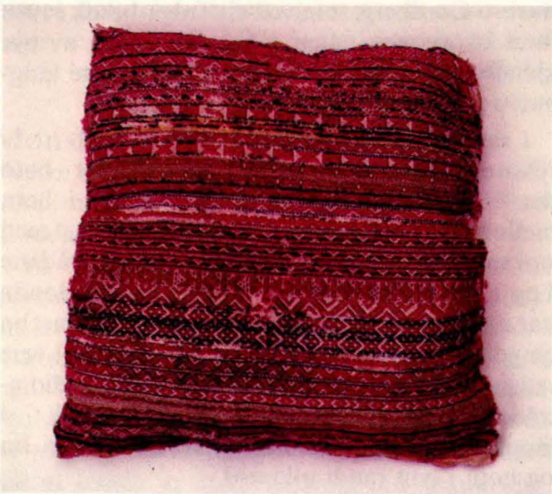
Bilde 7: Langpute 6 (halv) frå Tolga. Privat eige.