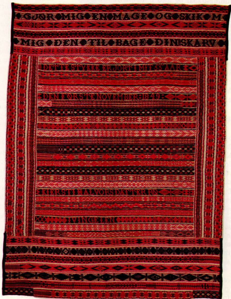
Bilde 2: Fellåkle/bandåkle frå Dals- bygda, Os. Privat eige.