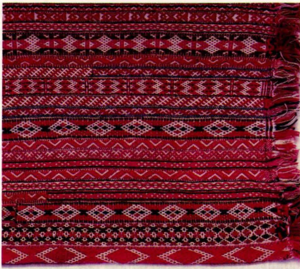
Bilde 6: Langpute 5 frå Tolga. Privat eige.