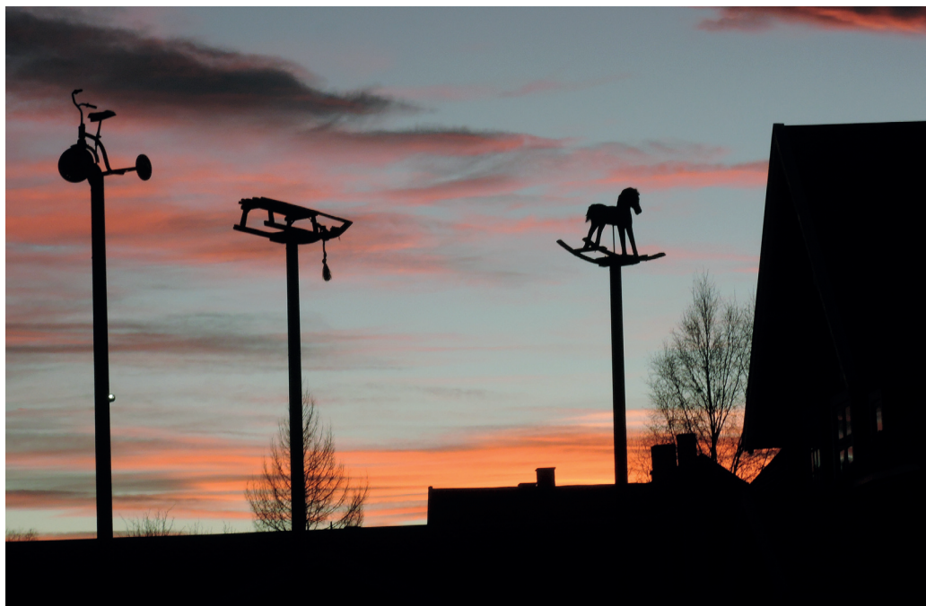
Leke-skulpturer. Ramsmoens utendørsskulpturer åpenbarte seg i kveldslyset.

ut fra en «ut-strategi» i vår formidling, en strategi som gjør at vi blir oppfattet som en relevant og uredde samfunnsaktør som utfordrer og skaper refleksjon. Vi har også startet tilretteleggingen for å bruke den digitale løsningen Kulturpunkt på alle anlegg. Og gjennom den formidle våre tun, samlinger og historie. Arena og arrangementsutvikling er viktig for vår virksomhet, og styrking av samarbeidet med alle eiere av museumsanlegg gir gode resultater for vårt arbeid. Våre strategier for fremtida er forankret i det arbeidet vi allerede gjør og i Anno museum sine mål og visjoner.