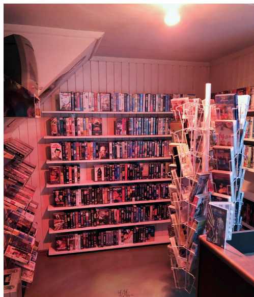
Luguber sjappe. Kino og filmmuseet i Rambu på Tynset fikk ei «video-sjappe» som tilvekst på høstparten.

Det var spennende dager ved Musea i Nord-Østerdalen i 2020!