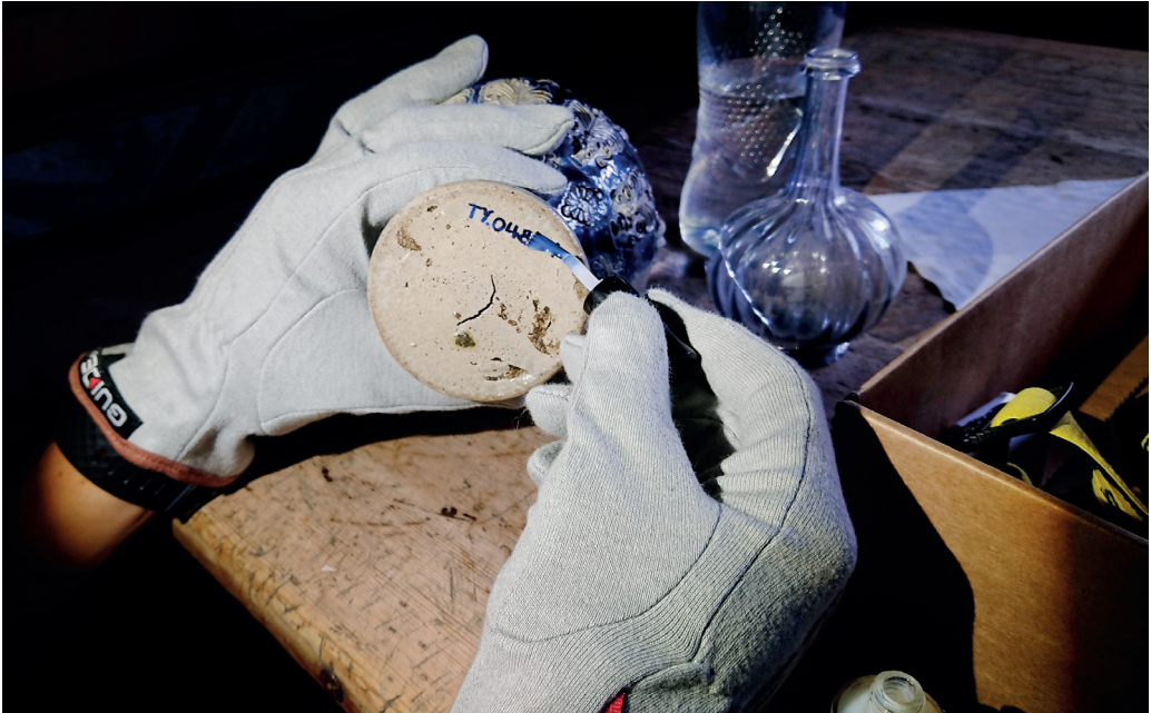
Revisjonsarbeid krever mye nitidig arbeid.