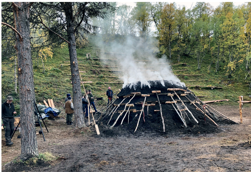
Kølmile. Kølbrennerdagan i Nørdalen i Os kommune var meget populært.

større grupper med tilreisende, da vi virkelig ønsker å vise fram dette fantastiske anlegget til flest mulig.