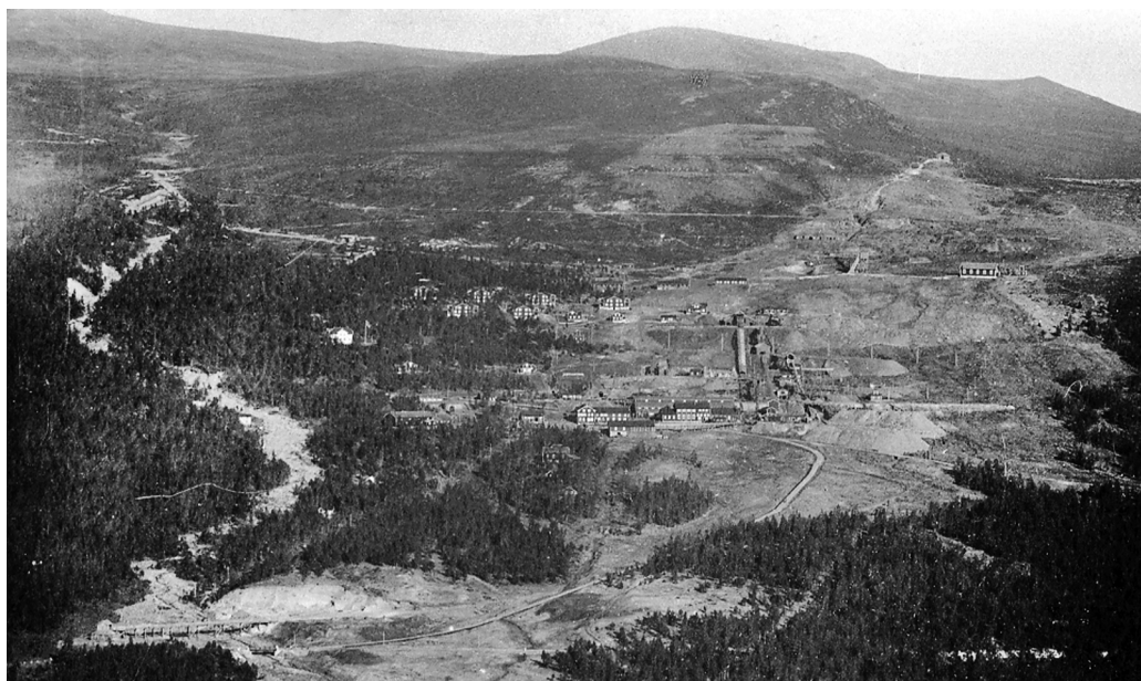
Folldalsverket fotografert om lag 1910. I området nede til venstre lå smeltehytta til Foldalens Interessentskab, litt ovenfor dette var det påbegynt en grunnstoll som skulle inn på djupet i gruva, og i dette området skulle jernbanestasjonen til det planlagte sidesporet til Østerdalsbana plasseres. Originalen litt beskåret.

Han drev altså det vi i dag kaller lobbyvirksomhet for saken, blant stortingsrepresentantene. Dette var bare to år etter at han sjøl slutta som stortingsmann, så han var kjent med både viktige personer og hvordan en skulle gripe slike saker an.