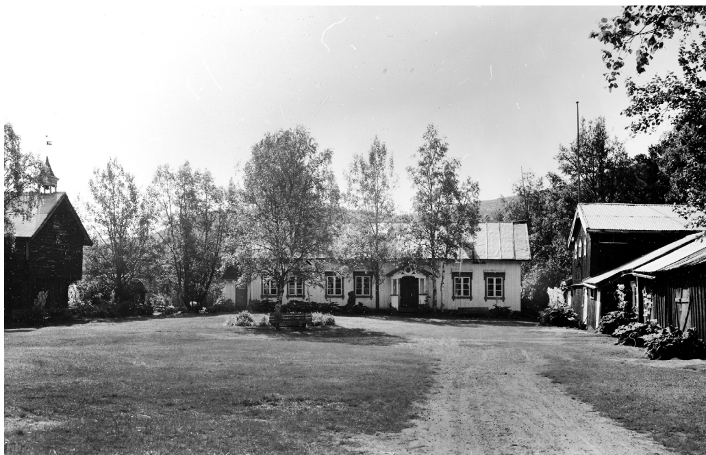
Einabu. F.v. buret, hovedbygninga og drengestua. nr. minø.049260.

i årboka i 1882, altså noen få år etter at de flytta dit. Ellers har jeg i denne artikkelen brukt forma Egnund, da mer om området.