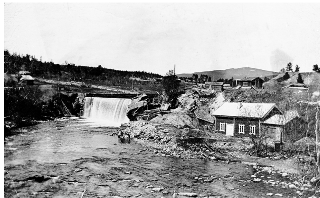
Kraftstasjonen ved Tunnfossen. Her lå Forsøgets Brug, bygd opp fra 1843. Inntil fossen på høyre side ses rester etter mølle og stampe, og oppi bakken t.h. lå sagbruken. Kraftstasjonen vart satt i drift aller sist på 1897.