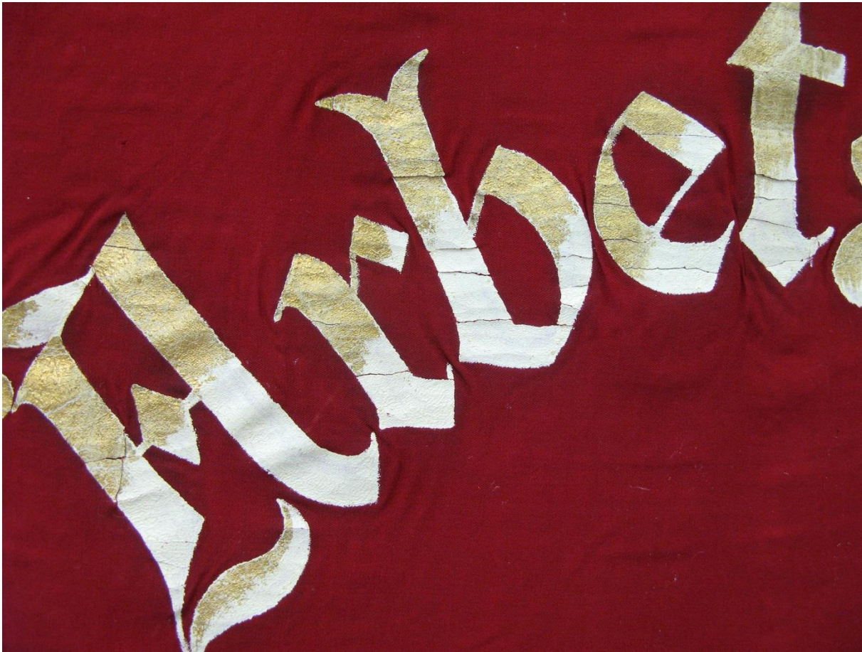
Bild 3 – Det röda ylletyget har krympt efter användande ute, och de målade bokstäverna som inte förändrats har då blivit för stora och spruckit.