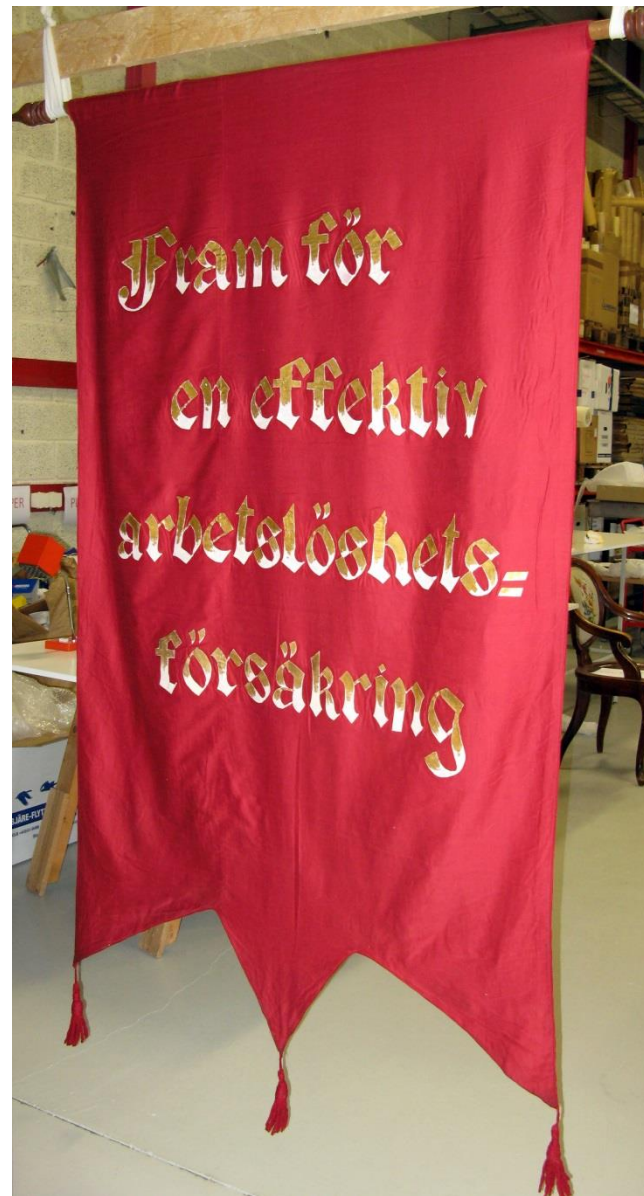
Bild 1 och 2 – helbilder på fram- och baksida, båda med bemålade textremсор