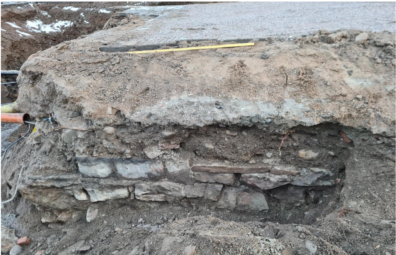
Figur 3. Framrensad del av husgrund i schakt 1, fotat mot öster.