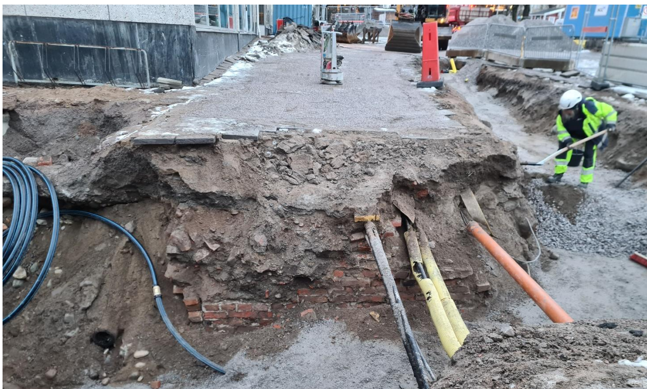
Figur 4. Till höger i bilden rensas husgrunden fram. Centralt i bilden syns resterna av en tegelvägg/skorstensfundament. Fotat mot sydsydöst.