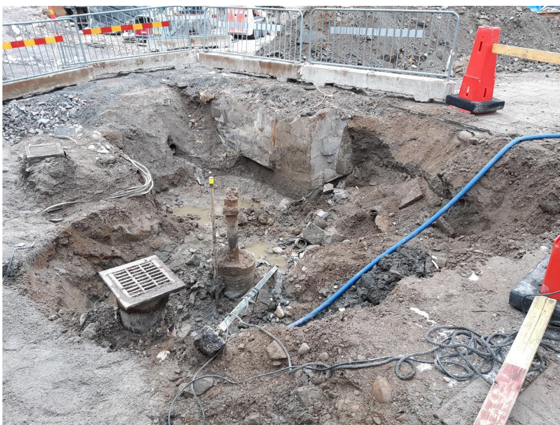
Figur 9. Schakt 5, inget av arkeologiskt intresse kunde observeras här.