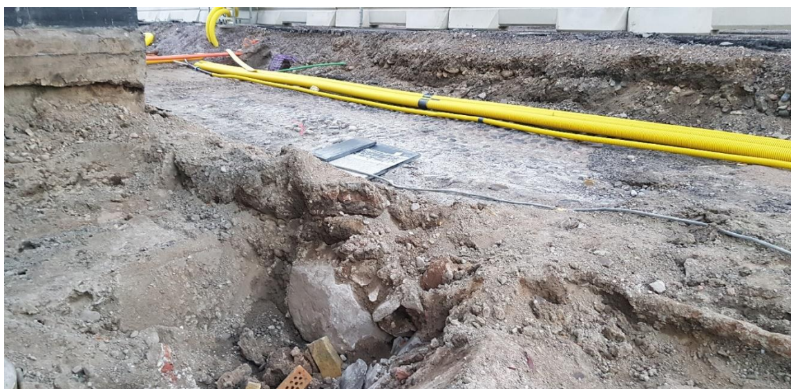
Figur 7. Övre delen av djupschaktet (schakt 4) med grundsten i kanten.