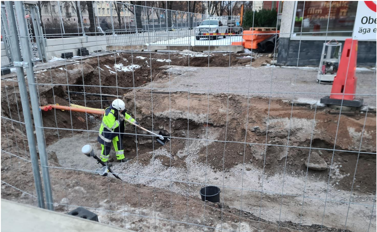
Figur 2. Schakt 1 under framrensning av husgrunden i schaktprofilen, fotat mot öster.