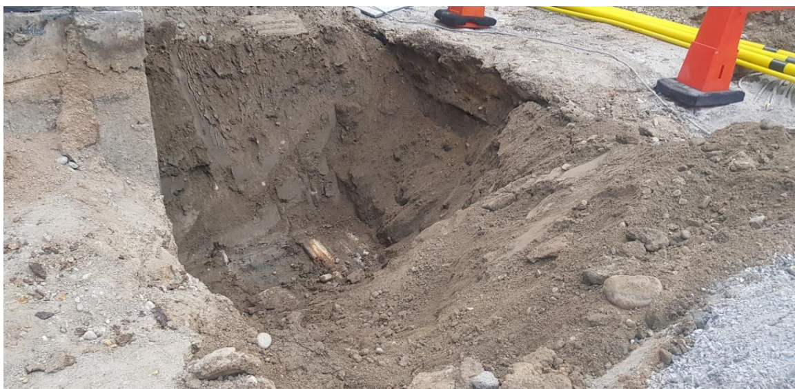
Figur 8. Nedre delen av djupschaktet (schakt 4) med träplankor/eventuell rustbädd i botten.