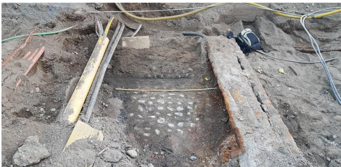
Figur 6. Östra kullerstensytan framrensad (schakt 3).