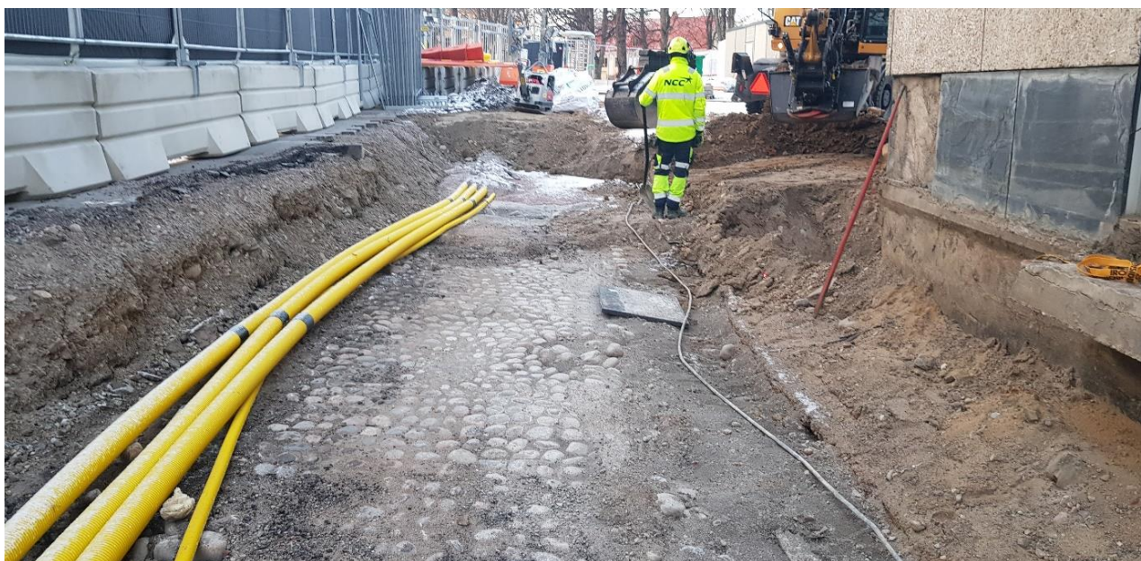
Figur 5. Västra kullerstensytan (schakt 2) fotad från öster.