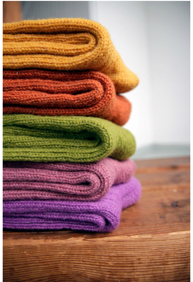
Raggsokkane frå TIM er populære i nettbutikken.

Vi kan elles nemne at boka TIM har laga og gav ut i 2018, Ruter og lus , vart omsett til engelsk med tittelen Squares, Stripes & Lice , og kan no kjøpast i engelsktalende land, i museumsbutikken og andre bokhandlar.