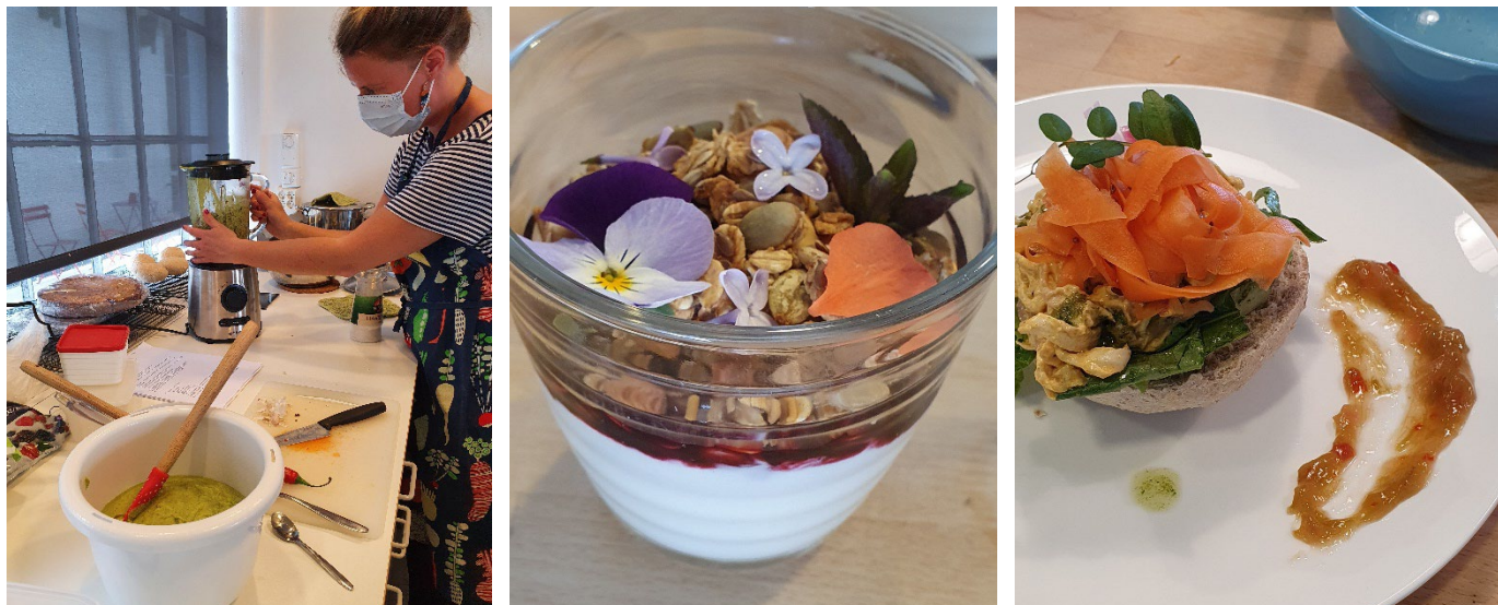
Matkurs med Stene matglede i forkant av sommarsesongen.

Mål – før Covid-19: Ivareta strikkepublikummet gjennom strikkekafear og Bergen Strikkefestival, men òg jobbe med å nå publikum med interesse for industrihistorie og sosialhistorie. Samstundes skal vi nå det museumsinteresserte publikummet og rette oss mot dei vi trur ønskjer å oppsøke Galleri Salhus. Vi skal òg halde oppe den høge kvaliteten vi har på pedagogiske tilbod til barnehagar, grunnskulen og vidaregåande skular, og på tilbod til grupper og andre gjestar på museet.