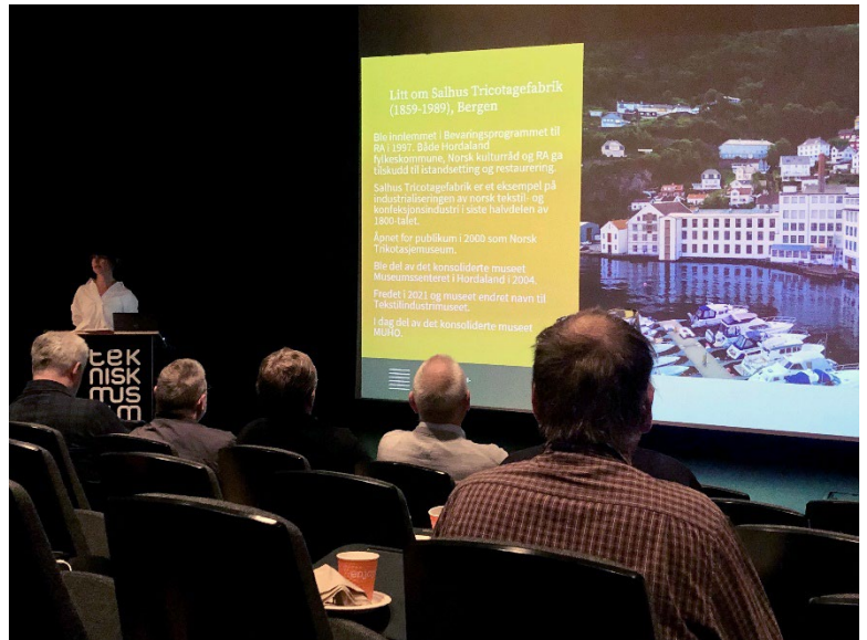
Foredrag om Salhus Tricotagefabrik på Riksantikvaren sitt årlege fagseminar for teknisk-industrielle kulturminne i oktober.