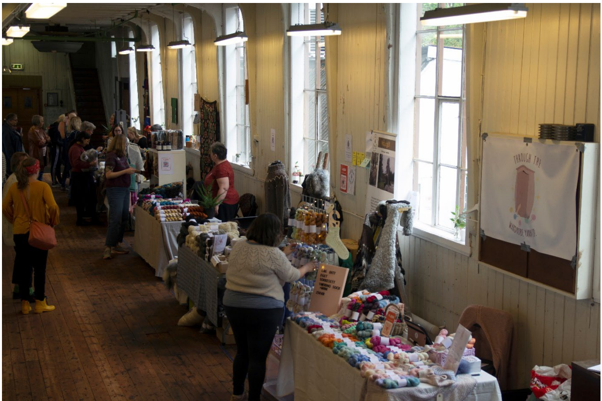
Under årets utgave av Bergen Strikkfestival blei marknaden flytta til spoleloftet.