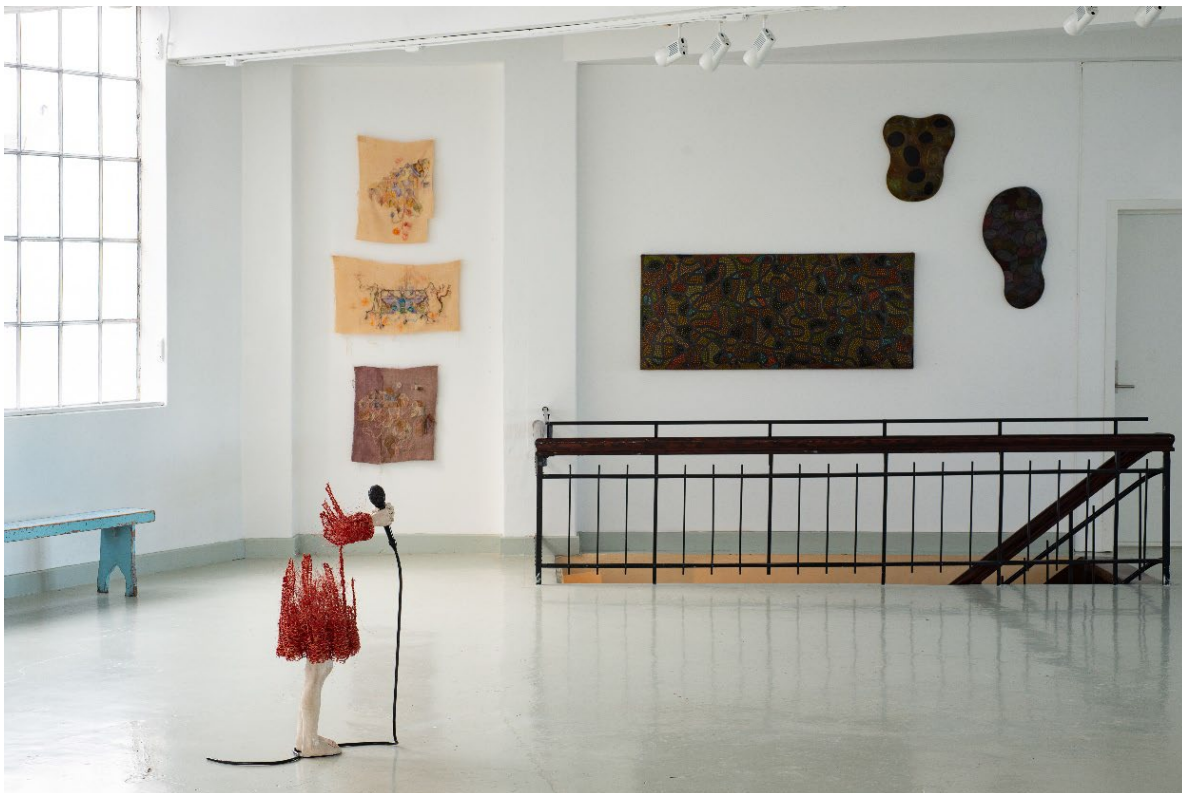
Bilete frå utstillinga «Undring og erindring».