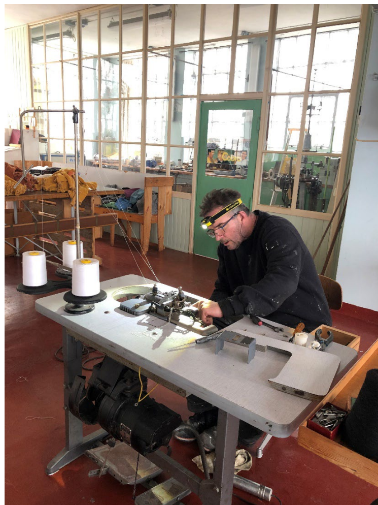
Arbeid med symaskiner på syloftet.