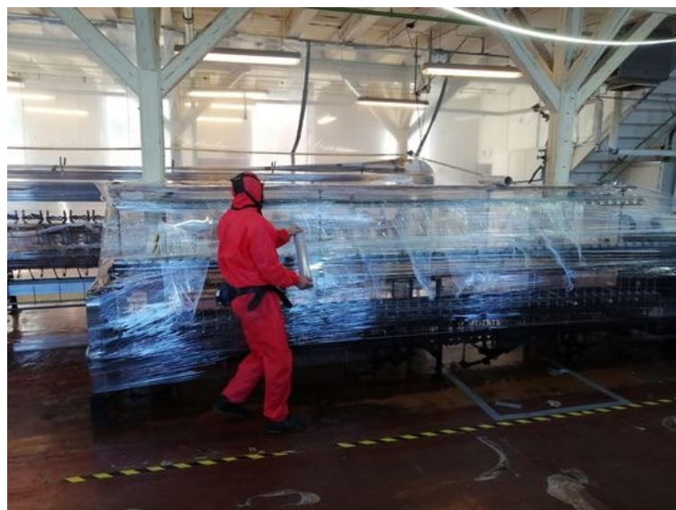
Maskinene på spoleloftet vart dekkta til før asbestsanerina.