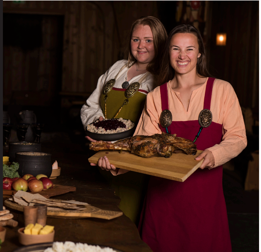
Bilde: Gildehallen, Midgard vikingsenter.