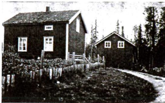
Rudmali veivokterbolig, Nordlandsveien.

værelser og kjøkken samt matbod og bislag i 1. etasje samt 2 værelser og klæskott i loftetasjen.