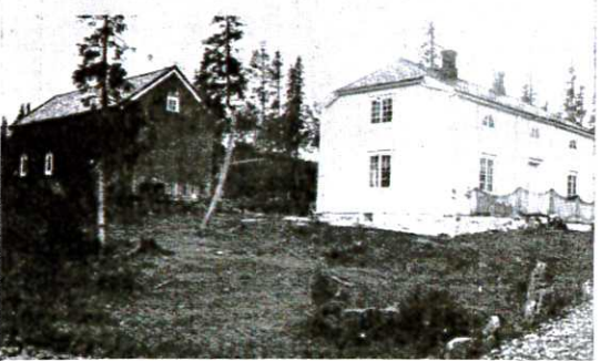
Veivokterboliger på Jemtlandsveien.