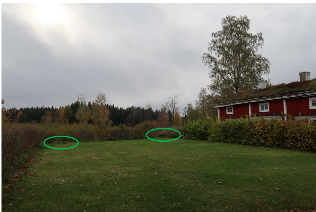
De gröna cirklarna markerar var lönnarna tidigare stod framför drängstugan.

Två nya lönnar planteras på ytan framför drängstugan som idag används för kaféets gäster. De nya träden planteras så nära de ursprungliga trädens platser som möjligt. De tidigare lönnarna stod mycket nära stödmuren av sten vilket påverkat stenvuren. I arbetet med att projektera stenvurarna och åtgärda desamma så tas hänsyn till en nyplantering av dessa två träd för att gynna lönnarna, men också för att skydda stenvuren och det lilla lusthuset som finns i stödmuren.