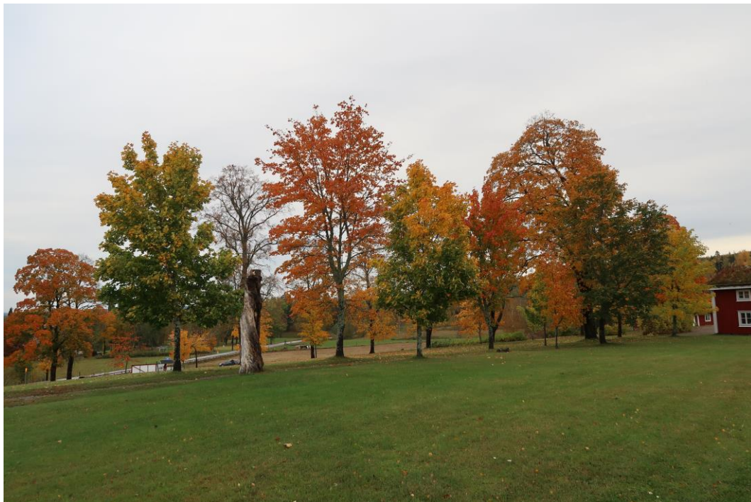
Alléerna upp till gårdstunet.