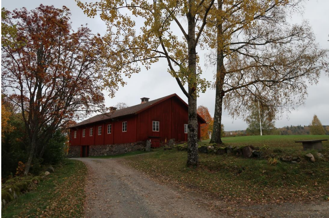
Två björkar mellan logen och vaktmästarbostaden.

Träd som står i anslutning till vaktmästarbostaden bör stå kvar. Tas de ner bör de återplanteras eller på sikt strategiskt släppas upp. I västra kanten av tomten mot vägen, bör rotskott från tidigare aspar släppas upp så att nya träd tillkommer. Söder om vaktmästarbostaden finns en liten skogsdunge vars karaktär av dunge bör bevaras.