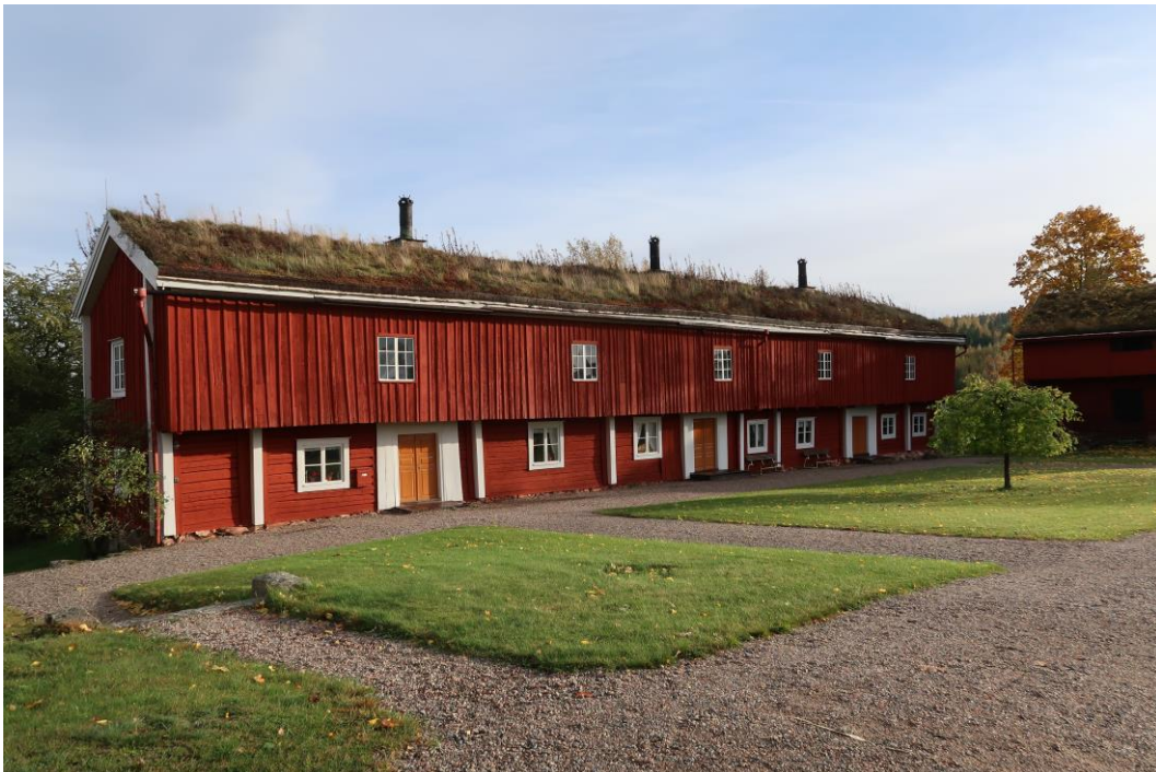
Mangårdsbyggnaden på Siggebohyttans bergsmansgård. Gårdstunet fick en annan gestaltning på 1930 och 40-talen, men en hängask står fortfarande framför mangården.

Gården är som byggnadsminne, skyddad enligt kulturmiljölagen och som kulturmiljö och riksintresse för kulturmiljövården av miljöbalken. Som trädgård finns också Florensdeklarationen att förhålla sig till.