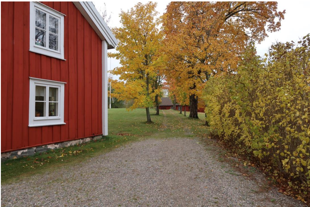
Storleken på träden varierar. Det saknas också flera träd i alléraderna.

Vissa av de befintliga träden är mycket små. De står troligtvis i för dålig jord och kan ha varit för små då de planterades. De större träden som står invid suger upp näringen och de mindre träden får då svårt att växa. Vissa träd är sk tysklönn som inte är anpassad för vårt klimat.