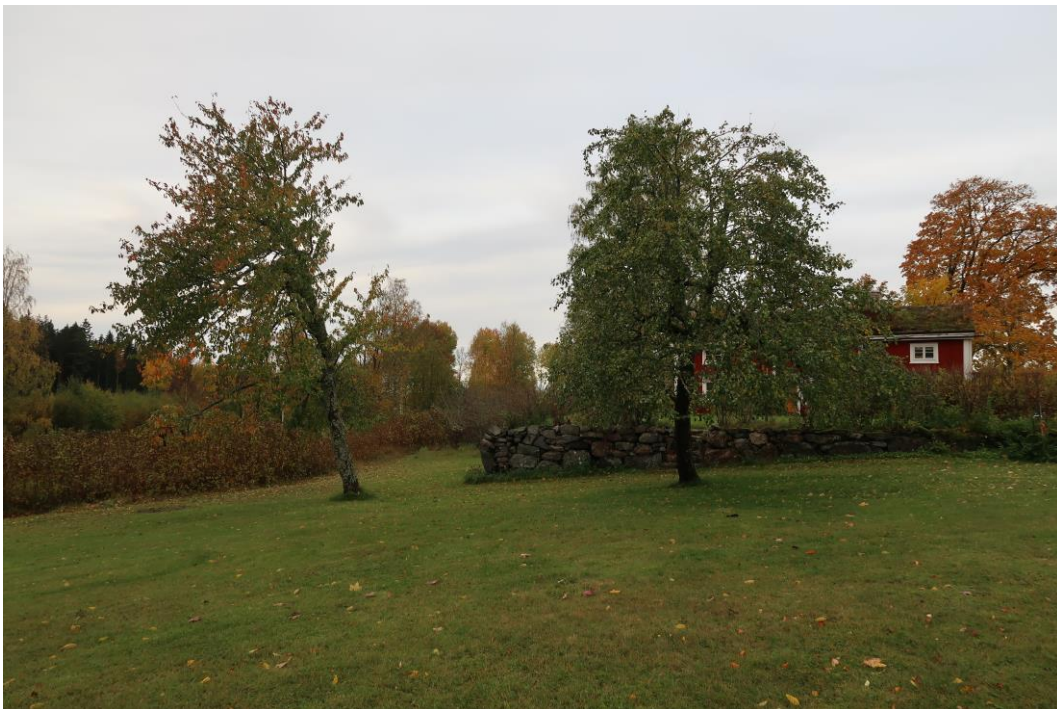
Päron och äppelträd i den södra delen av trädgården.

Det vore intressant att se om det gick att få reda på mer om äpple, päron och körsbärssorterna. Det skulle också kunna ge en indikation om ålder på träden. (Genbanken Alntorps ö/SLU Alnarp, Julita/Nordiska museet). Det finns också en möjlighet att ta ympris från träden för att föryngra dem i framtiden.