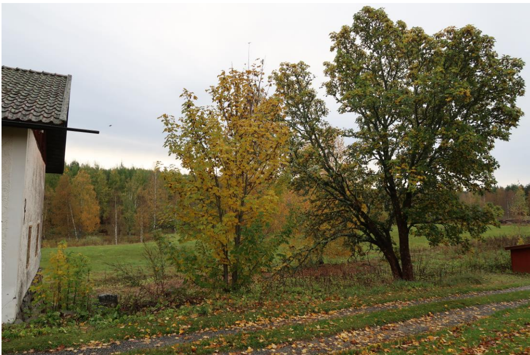
I och invid stödmuren vid stallet växer flera träd.

Under 2021 togs en stor asp ner som stod invid muren längs vägen till Lindesberg. Den bedömdes av arboristen som fällde trädet vara ca 100-120 år. Det innebär att den började växa omkring förra sekelskiftet eller strax därefter. Även en mindre rönn som stod längs muren togs ner då den dött.