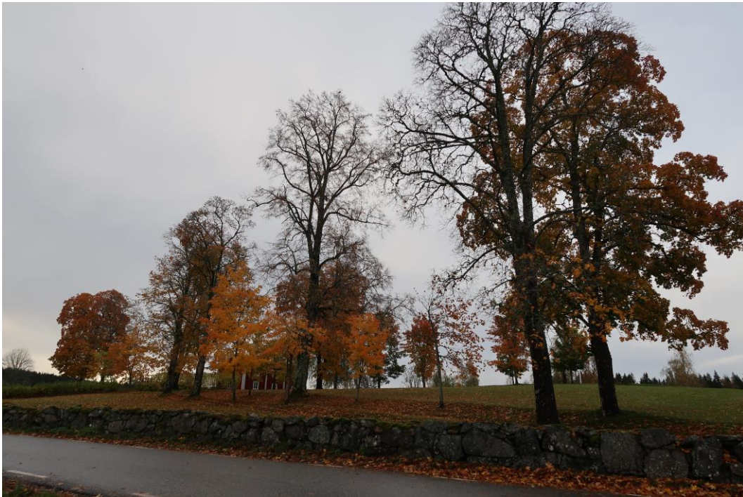
Norra allén med stor variation i storleken på träden. Det större trädet, i mitten av bilden, är en skogslind.

Ett av träden är en skogslind. Den bedömdes av arboristen var ca 100 år, men det finns många faktorer som påverkar tillväxten av träd. Vid en ev nedtagning av trädet i framtiden bör dess ålder undersökas närmare för att få mer kunskap om när det planterats och för att kunna sätta det i sitt sammanhang och besluta om lämplig åtgärd därefter.