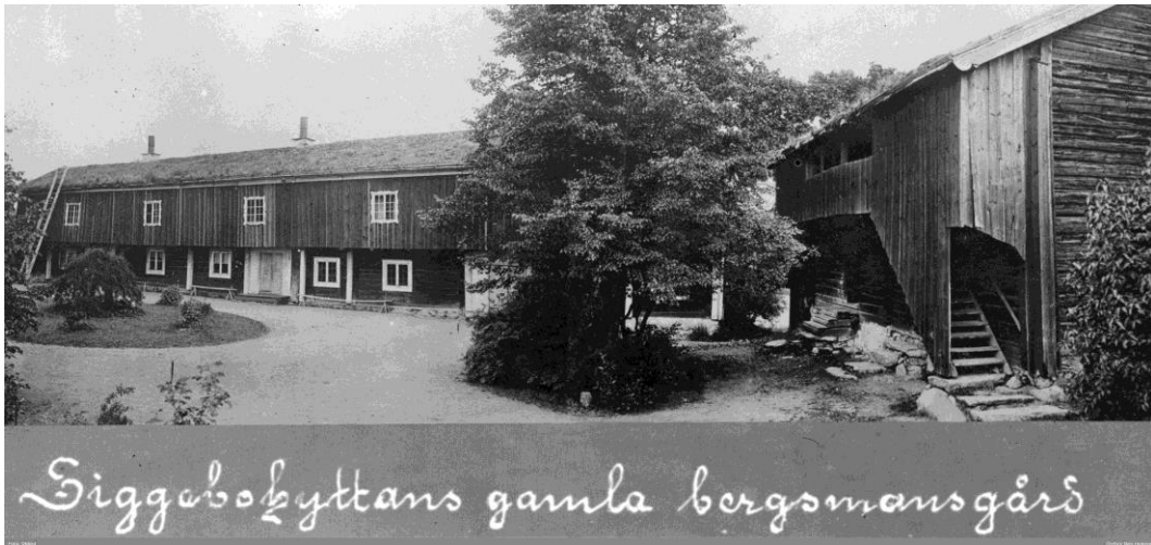
Bild på gårdstunet från sent 1800-tal. En hängask i rundel som omges av dahlior, mitt på tunet. Framför loftboden växer ett träd och någon buske.