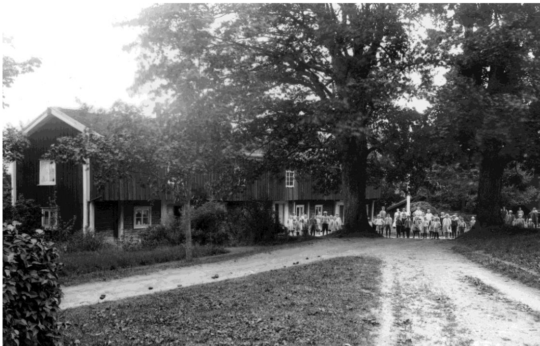
Siggebohyttan tidigt 1900-tal. De två alléerna möts vid gårdstunet där parlönnarna står. Någon form av buskar ansluter mellan parlönnarna och mangårdsbyggnaden.

Enligt ägoskifteskartan utgör nr 47, det grå partiet på kartan samt alléerna och ytan vid logen, gamla tomten med trädgård. Nr 43 en backremsa och 44-45 och 46 åkrar, sandjord. 2 På kartan syns de två alléerna tydligt. Den norra är tydligare markerad. Kanske är det en klippt syrenhäck som löper längs allén?