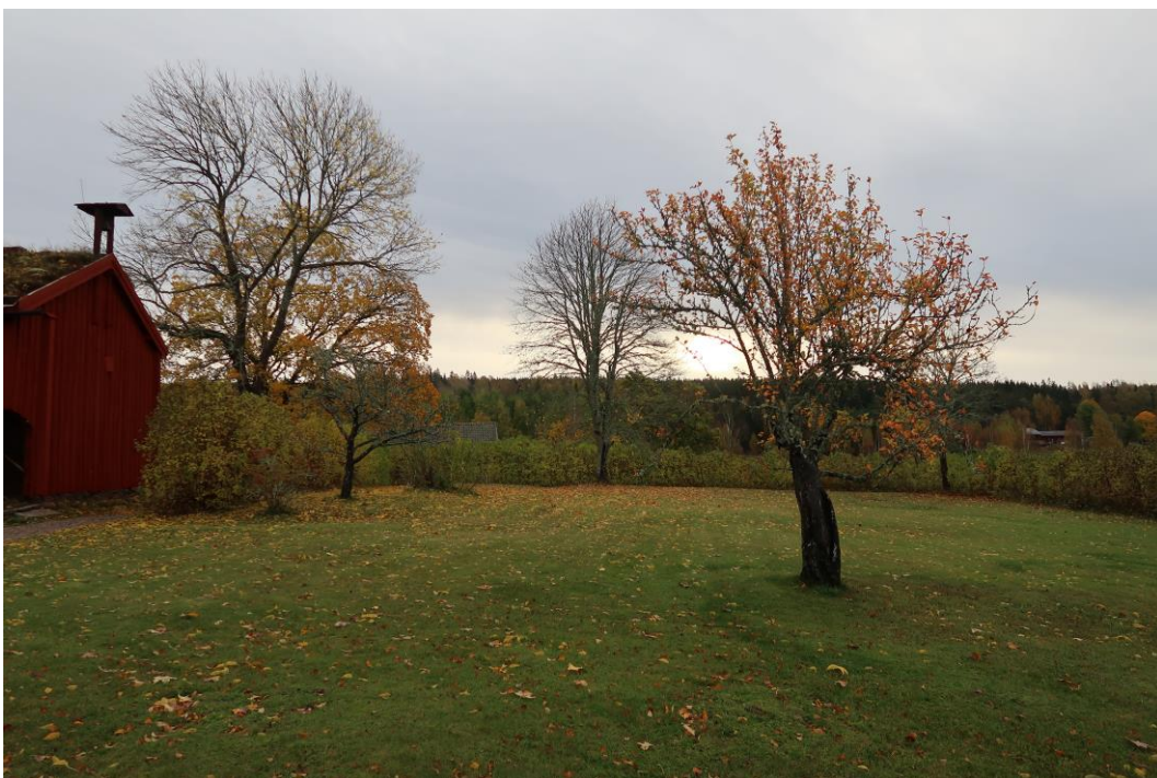
Äppelträd i den södra delen av trädgården.