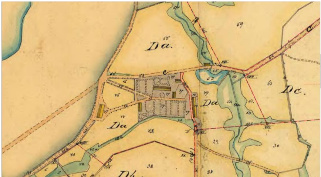
Lantmäteriets historiska kartor. Del av ägoskifteskarta från 1909 där den äldre indelningen av trädgård och åkrar syns tydligt.

Enligt ägoskifteskartan utgör nr 47, det grå partiet på kartan samt alléerna och ytan vid logen, gamla tomten med trädgård. Nr 43 en backremsa och 44-45 och 46 åkrar, sandjord. 2 På kartan syns de två alléerna tydligt. Den norra är tydligare markerad. Kanske är det en klippt syrenhäck som löper längs allén?