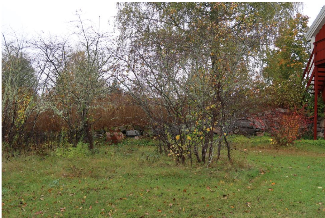
Körsbärssly nedanför drängstugan.

På terrassen nedanför drängstugan stod tidigare ett hönshus och mycket körsbär växte då upp som var svåra att gallra. Det bör nu ske och bara ett eller två skott/träd bör sparas.