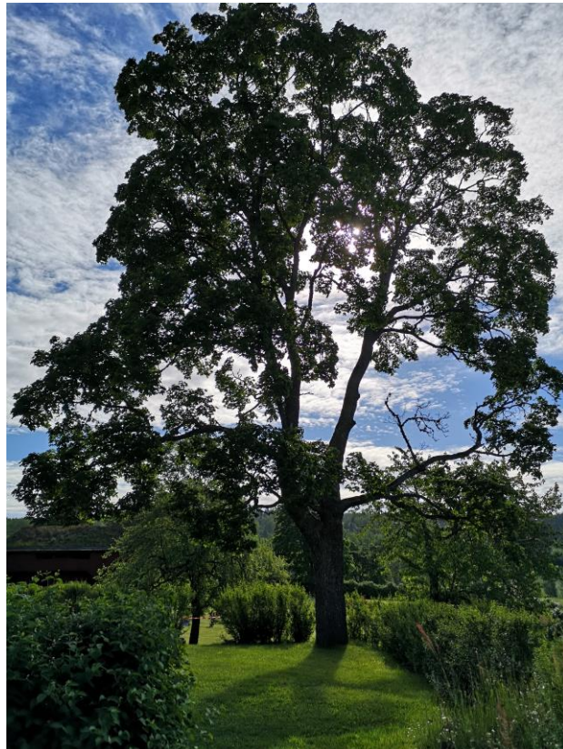
Lönnen som togs ner 2021.

Vid drängstugan och stödmuren ovanför lusthuset stod två lönnar. 2021 togs en av dem ner och den bedömdes vara ca 150 år av arboristen som fällde trädet. Det innebär att den skulle ha planterats eller släppts upp ca 1870, vilket är rimligt. Den andra lönnen togs ner några år innan.