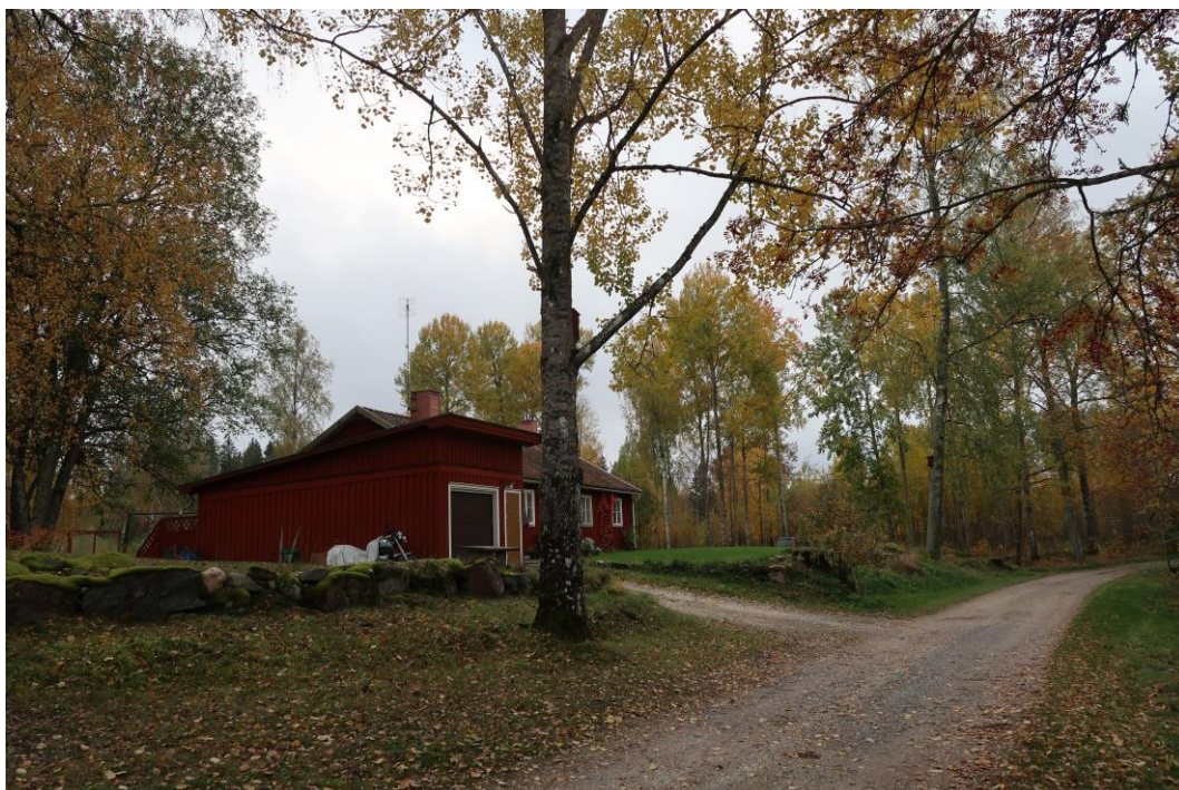
Några björkar står kvar invid vägkanten vid vaktmästarbostaden, efter att några aspar togs ner 2020.

År 2020 togs några mycket dåliga aspar ned som stod i kanten mellan tomten och vägen, väster om byggnaden.