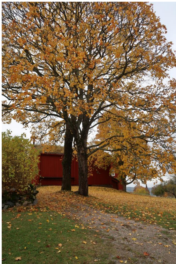
Två lönnar och en ask bakom loftboden.

Träd är ibland skyddade både av KML och MB samtidigt. Därför är en dialog med länsstyrelsen viktig vid en eventuell åtgärd, för att komma fram till lämplig avvägning och åtgärd och så att rätt dispens eller tillstånd erhålls.