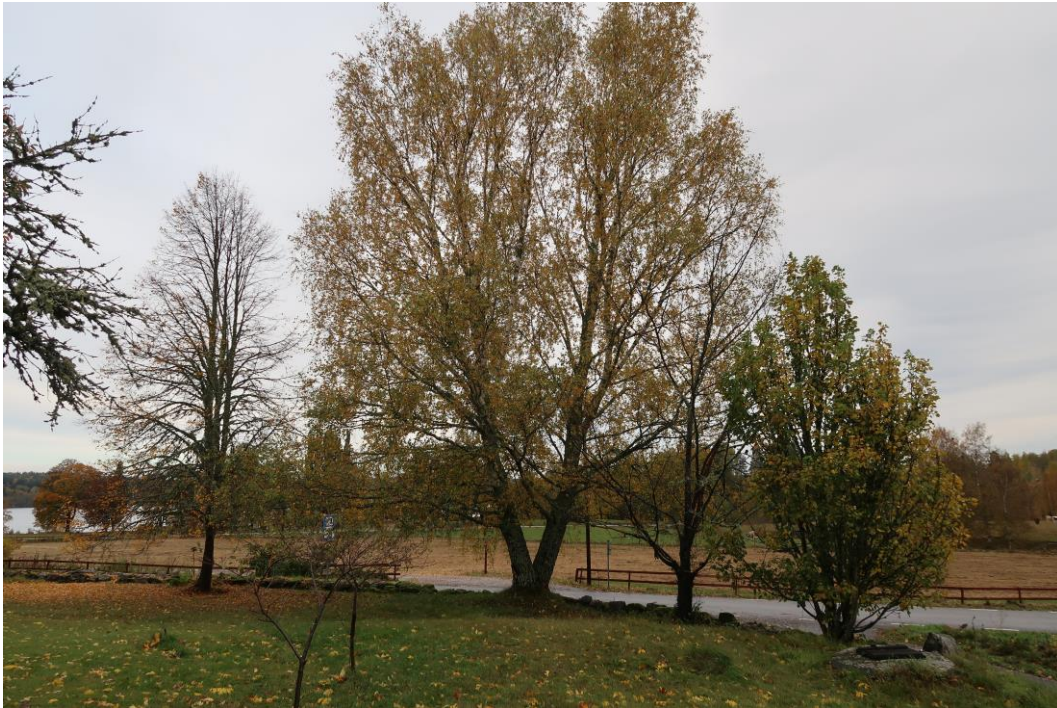
Storleken på träden varierar. Det saknas också flera träd i alléraderna. Träd som växer i och invid stenmuren längs vägen till Lindesberg.

Under 2021 togs en stor asp ner som stod invid muren längs vägen till Lindesberg. Den bedömdes av arboristen som fällde trädet vara ca 100-120 år. Det innebär att den började växa omkring förra sekelskiftet eller strax därefter. Även en mindre rönn som stod längs muren togs ner då den dött.