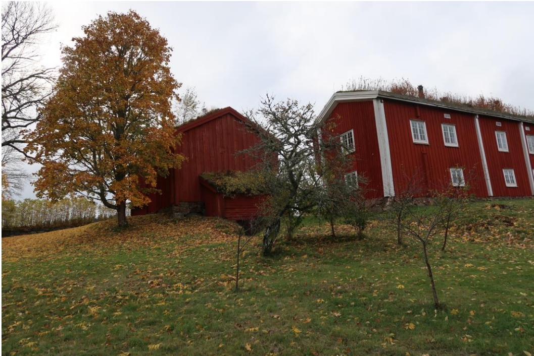
Gamla körsbärsträd och rotskott på tillväxt, bakom loftboden.

På terrassen nedanför drängstugan stod tidigare ett hönshus och mycket körsbär växte då upp som var svåra att gallra. Det bör nu ske och bara ett eller två skott/träd bör sparas.