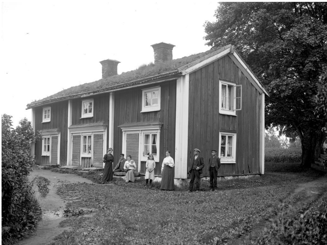
Bild på drängstugan från sent 1800-tal eller tidigt 1900-tal. I bakgrunden syns en trolig potatisodling samt lönnallén mot logen.

Sekelskiftet 18/1900 En bild över drängstugan visar allén och potatisodlingen bakom.