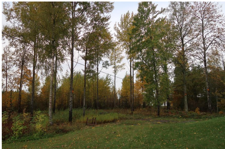
En liten skogsdunge söder om vaktmästarbostaden.