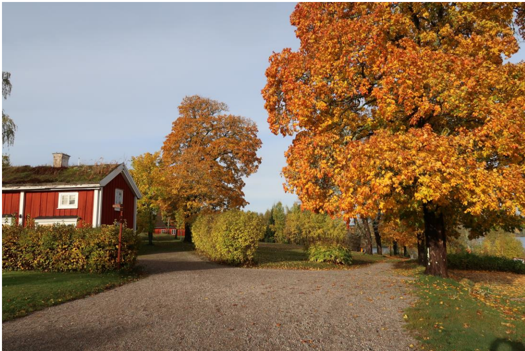
Alléerna från gårdstunet