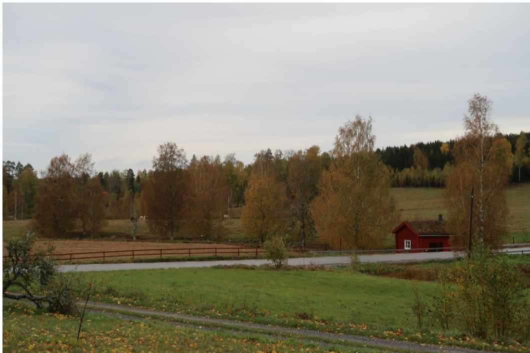
Träd längs bäcken bakom smedjan.

Fabian Mebus (red.), Fria eller fälla , RAÄ m. fl. 2014, Kalmar.