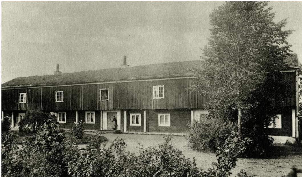
Bilden är troligtvis tagen sent 1800-tal.

Gården gick ur familjens ägo 1901 och ägdes en period av Guldsmedshytte Aktiebolag. Sedan 1910 ägs anläggningen av Örebro läns museum. 1929 genomgick mangårdsbyggnaden en omfattande restaurering där den inreddes till ett museum. Det är mycket av det vi ser än i dag. Även trädgården har genomgått stora förändringar. De skedde på 1930-talet och dåtidens ideal var att återställa. I dag återställer vi oftast inte utan tar hänsyn till en byggnads eller miljöns hela historia och de förändringar (årsringar) som en byggnad eller miljö har genomgått.