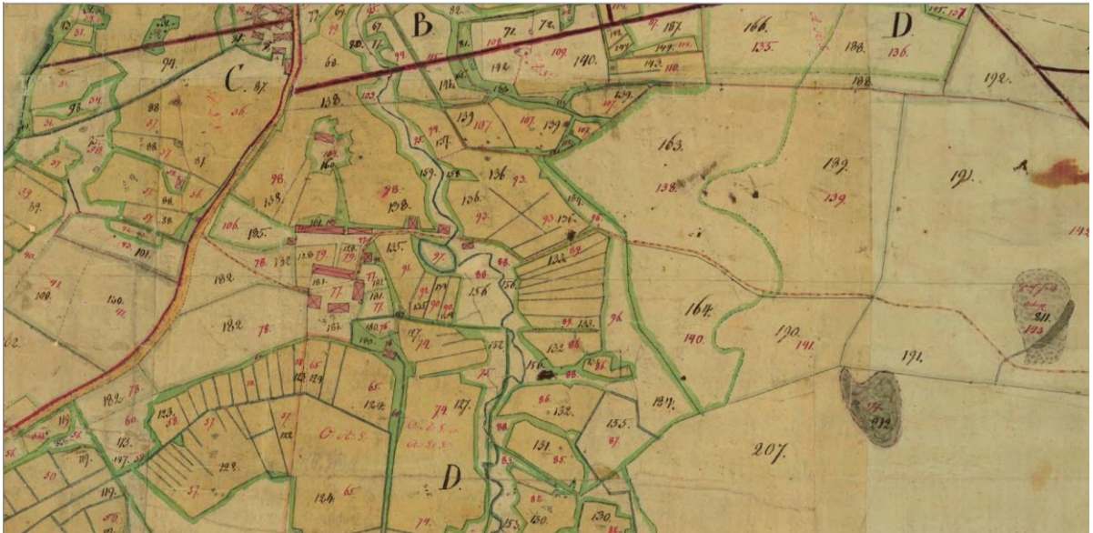
Lantmäteriets historiska kartor. Del av enskifteskarta från 1819/20. Gårdsbilden skiljer sig från dagens.