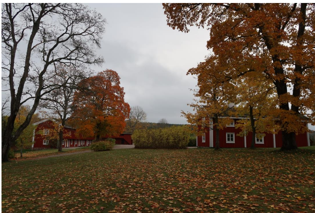
Alléerna möts vid gårdstunet och drängstugan.

För gården har strukturerna med alléer, parlönnar, de båda lönnarna utanför drängstugan och hängasken framför mangården ett högt kulturhistoriskt värde. Hagtornsträdet har ett högt kulturhistoriskt värde.