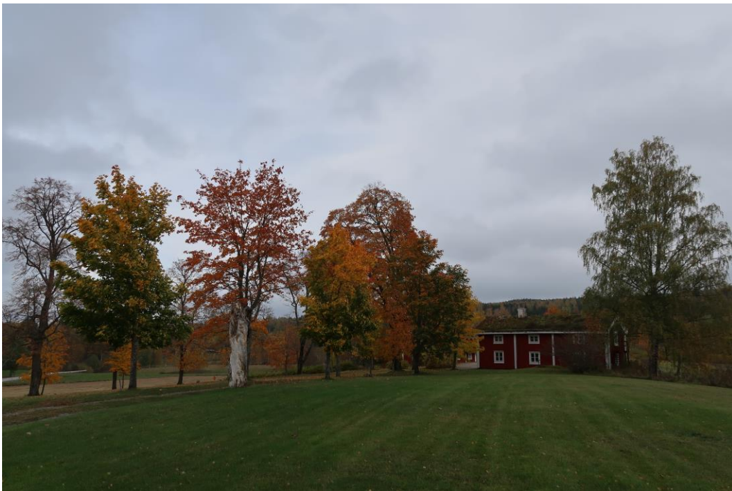
Alléerna till gårdstunet samt en björk som står bakom drängstugan, i utkanten av anläggningen. Det saknas flera träd i alléerna.

Gården ser idag inte likadan ut som för 150 år sedan men att bevara strukturerna med alléer, återplantera parlönnarna vid gårdstunet och parlönnarna utanför drängstugan, bevara hagtornen samt vårda de fruktträd och övriga träd som finns ger karaktär till och bevarar den kulturhistoriskt värdefulla miljön. Det ger en möjlighet att visa och berätta om bergsmansgården och de människor som bott där.