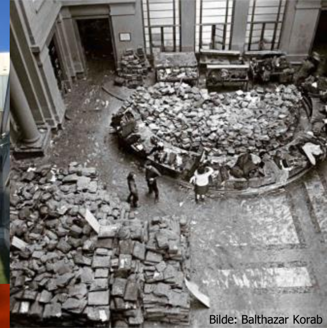
Bilde: Balthazar Korab