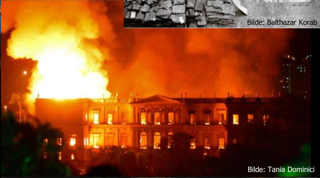
Bilde: Tania Dominici