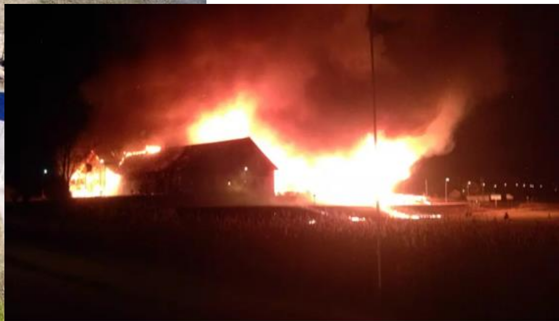
Grafikens hus brinner.