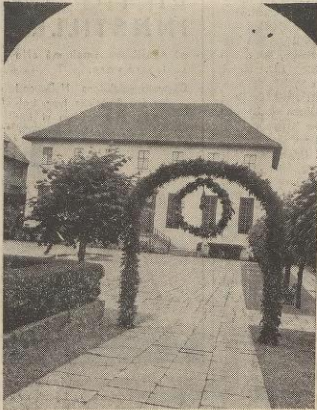
Til vinstre: Midtbygningen i den nye avdelinga. I kanten av bildet ser vi litt av vinstre sidebygninga. Til høgre: Hallingdalsrommet i vinstre sidebygning.