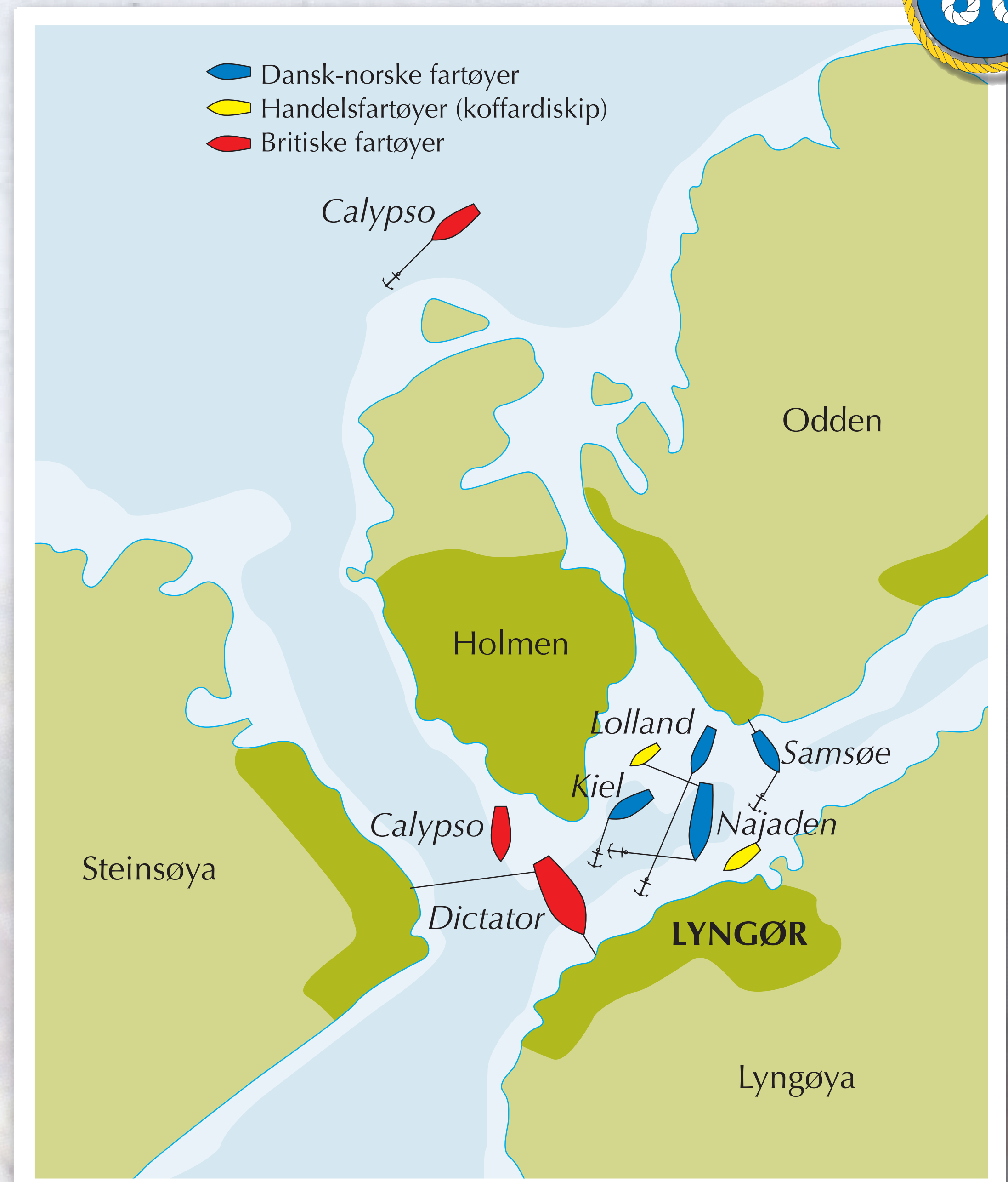
Kiel, Lolland, Samsøe, Najaden, Calypso, Dictator og Handelsskip i Lyngør havn.